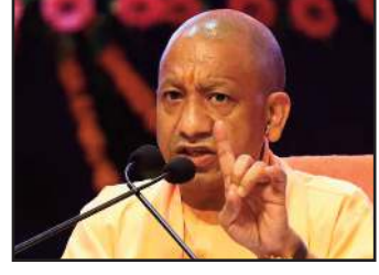
उज्वला योजना, मिशन शक्ति, स्वयं सहायता समूह, लखपति दीदी, कन्या सुमंगला योजना जैसी पहलों ने महिलाओं को न केवल सामाजिक रूप से सशक्त बनाया है, बल्कि उन्हें आर्थिक रूप से आत्मनिर्भर बनने का अवसर भी प्रदान किया है।

महिला सशक्तीकरण की पहली शर्त सुरक्षा है, महिलाओं को सुरक्षित वातावरण नहीं मिलेगा तो शिक्षा, रोजगार और स्वावलंबन के अवसर भी सीमित रह जाएंगे। योगी सरकार ने सत्ता संभालने के बाद महिला सुरक्षा को सर्वोच्च प्राथमिकता दी। प्रदेश में एंटी रोमियो स्क्वाड का गठन किया गया, महिला हेल्पलाइन 1090 को मजबूत किया गया, महिला डेस्क की स्थापना की गई तथा मिशन शक्ति अभियान के माध्यम से व्यापक जनजागरूकता पैदा की गई। महिला सुरक्षा को और मजबूत बनाने के लिए पुलिस बलों में महिलाओं को 20 प्रतिशत आरक्षण दिया गया। इसका परिणाम यह हुआ कि प्रदेश में महिला पुलिसकर्मियों की संख्या बढ़कर 44 हजार से अधिक हो गई।