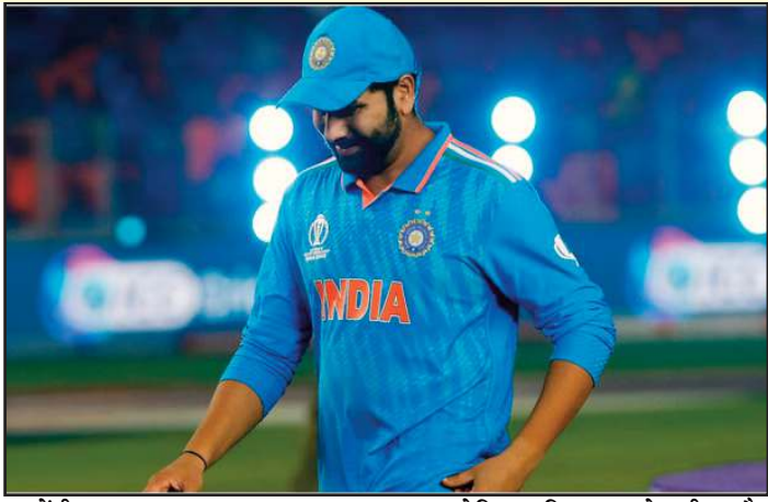
चोटिल विराट कोहली और

टीम इंडिया वनडे सीरीज में अजेय बढ़त लेने के लिए बुधवार को अफगानिस्तान के खिलाफ मैदान में उतरेगी। भारतीय टीम शुभमन गिल और अफगानिस्तान टीम हशमनुल्लाह शहीदी की कप्तानी में इकाना स्टेडियम में दोपहर 1:30 बजे से मुकाबले को