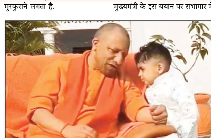
मुख्यमंत्री के इस बयान पर सभागार में

से आगे बढ़ा। योगी ने कहा कि एफआईआर दर्ज होने के अगले ही दिन प्रशासन ने बुलडोजर कार्रवाई शुरू कर दी। अवैध कब्जे को हटाने के लिए पूरी सरकारी मशीनरी सक्रिय हो गई। कुछ ही समय में वह जमीन माफिया के कब्जे से मुक्त करा ली गई। मुख्यमंत्री ने कहा कि सरकार की मंशा साफ हो तो कानून का राज स्थापित करने में देर नहीं लगती। जहां कब्जा था, वहां बना फॉरेंसिक इंस्टीट्यूट योगी आदित्यनाथ ने बताया कि जमीन खाली कराने के बाद सरकार ने उसे यूं ही नहीं छोड़ा। उन्होंने कहा कि उसी जमीन पर बाद में फॉरेंसिक इंस्टीट्यूट का निर्माण कराया गया। मुख्यमंत्री के अनुसार यह सिर्फ अवैध कब्जा हटाने की कार्रवाई नहीं थी, बल्कि एक सकारात्मक बदलाव का उदाहरण भी था। जिस जमीन पर कभी पहुंचे। डीजीपी ने उन्हें जानकारी दी कि लखनऊ में पुलिस विभाग की एक महत्वपूर्ण जमीन पर माफिया का कब्जा है। वर्षों से उस जमीन पर अविधेय कब्जा बना हुआ था और विभाग उसे खाली नहीं करा पा रहा था। मुख्यमंत्री ने बताया कि जैसे ही उन्होंने यह बात सुनी, उन्होंने तुरंत कहा, यह तो मेरा सबसे प्रिय विषय है। एफआईआर हुई, अगले दिन पहुंच गया बुलडोजर मुख्यमंत्री ने बताया कि उन्होंने अधिकारियों को तत्काल कार्रवाई के निर्देश दिए। सबसे पहले संबंधित माफिया के खिलाफ एफआईआर दर्ज कराई गई। इसके बाद घटनाक्रम तेजी