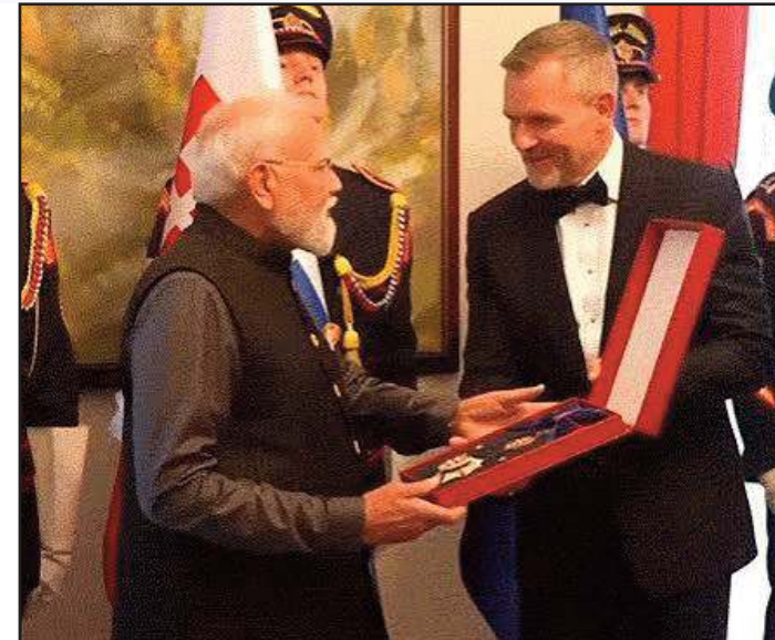
एक समारोह में उन्हें यह सम्मान प्रदान किया।

सम्मान का प्रतीक है। साथ ही, यह अंतरराष्ट्रीय साझेदारियों को सुदृढ़ बनाने, साझा समृद्धि को बढ़ावा देने और देशों के बीच स्थायी मित्रतापूर्ण संबंध विकसित करने में प्रधानमंत्री के असाधारण योगदान को मान्यता देता है।