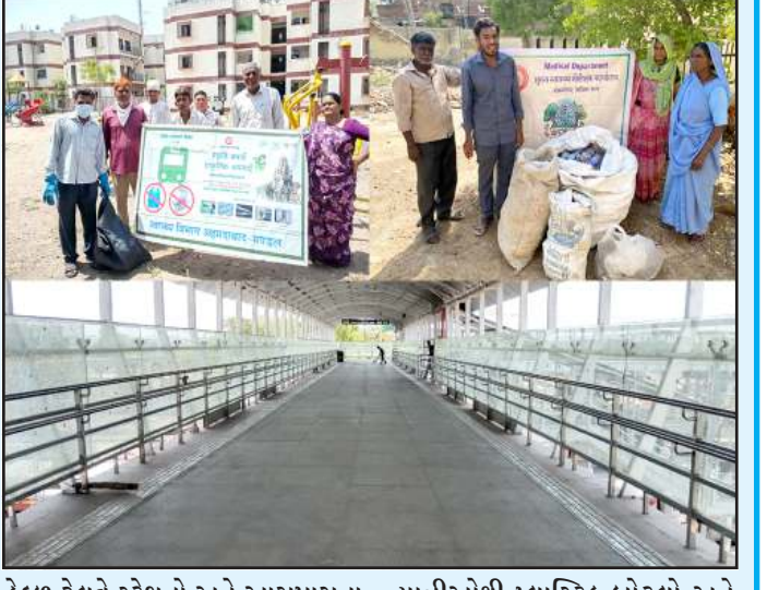
રેલવે સ્ટેશનો અને આસપાસના વિસ્તારોમાં વિશેષ સફાઈ અભિયાન ચલાવવામાં આવ્યું. પ્લેટફોર્મો પર કચરા પુથકરણ વ્યવસ્થા સુનિશ્ચિત કરવા માટે વિશેષ અભિયાન સંચાલિત કરવામાં આવ્યું તથા યાત્રીઓને કચરાના યોગ્ય નિકાલ પ્રત્યે જાગૃત કરવામાં આવ્યાં.

પશ્ચિમ રેલવેના અમદાવાદ મંડળ દ્વારા વિશ્વ પર્યાવરણ દિવસ હેઠળ વિવિધ રેલવે સ્ટેશનો પર સ્વચ્છતા, પર્યાવરણ સંરક્ષણ અને પ્લાસ્ટિક ઉપયોગમાં ઘટાડો કરવા માટે વ્યાપક જનજાગૃતિ અભિયાન અને વિશેષ કાર્યક્રમ સંચાલિત કરવામાં આવી રહ્યા છે.