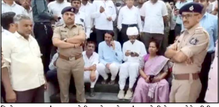
દિયોદર તાલુકા પંચાયત કચેરી ખાતે જ જમીન પર બેસીને ધરણા પર ઉતરી ગયા છે. જેને પગલે વહિવટી તંત્રમાં ભારે દોડામગમ મચી જવા પામી છે.

પ્રતિનિધિ, ગાંધીનગર બનાસકાંઠા જિલ્લાના દિયોદર તાલુકા પંચાયતના પ્રમુખ અને ઉપપ્રમુખની ચુંટણી પ્રક્રિયા અચાનક રદ કરવામાં આવતા સરહદી પંથકના રાજકારણમાં ભારે ગરમાવો આવી ગયો છે. ચુંટણી રદ થવાના સમાચાર વાયુવેગે ફેલાતા જ કોંગ્રેસ છાવણીમાં તીવ્ર રોષ ફાટી નિકળ્યો હતો. વાવ-થરાદ વિસ્તારના સાંસદ ગેનીબેન ઠાકોર મોટી સંખ્યામાં કોંગ્રેસના કાર્યકરો અને સમર્થકો સાથે