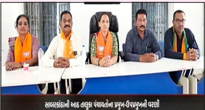
પંચાયતોમાં પ્રમુખ-ઉપપ્રમુખના પદ આદમી પાર્ટીના પદાધિકારીઓ સત્તારૂઠ થયા છે. પરીણામો જાહેર થતા જ નવનિયુક્ત પ્રમુખ અને

પ્રતિનિધિ, ગાંધીનગર તસવીર યુનુસ મેમણ સાબરકાંઠા જિલ્લાની ૮ તાલુકા પંચાયતોમાં ગઈ કાલે ચુંટણી અધિકારીના અધ્યક્ષસ્થાને સામાન્ય સભા યોજાઈ હતી. જેમાં ભારે ઉત્સાહ વચ્ચે પ્રમુખ અને ઉપપ્રમુખની વરણી પ્રક્રિયા હાથ ધરવામાં આવી હતી અને ત્યારબાદ સત્તાવાર રીતે નામોની જાહેરાત કરાઈ હતી. તાજેતરમાં યોજાયેલી સ્થાનિક સ્વરાજ્યની ચુંટણીઓ બાદ આ વરણીમાં ભાજપે ૭ તાલુકા