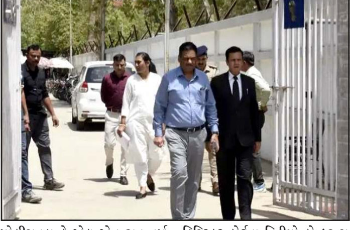
પોલીસવડા કે.એલ.એન.રાવે વર્ષ ૨૦૨૧ ના એક એસીબીના કેસમાં પ્રોસિક્યુશન મંજૂરી આપવા અનુસંધાને આજે મંગળવારે મહત્વની જુબાની આપવા માટે ગાંધીનગર

પ્રતિનિધિ, ગાંધીનગર ન્યાય તંત્ર અને પોલીસ વિભાગના સંયુક્ત પ્રયાસોથી સામાન્ય નાગરિકો, સાક્ષીઓ તેમજ પોલીસ અધિકારીઓ અને કર્મચારીઓનો ડિંમતી સમય બચાવવા તથા ઈંધણની મોટી બચત કરવાના આશયથી કોર્ટમાં જુબાની આપવા માટે વિડીયો કોન્ફરન્સ કેન્દ્રની અદ્યતન સુવિધાઓ ઉપલબ્ધ કરવામાં આવી છે. આ સુવિધા અંતર્ગત આજે મંગળવારે રાજ્યના પોલીસવડા ડો.કે.એલ.એન.રાવે પોતે આ આધુનિક ટેકનોલોજીનો લાભ લઈ સમાજ અને પોલીસ વિભાગ સમક્ષ એક ઉન્નત અને પ્રેરણારૂપ ઉદાહરણ પુરૂ પાડ્યું છે. રાજ્યના