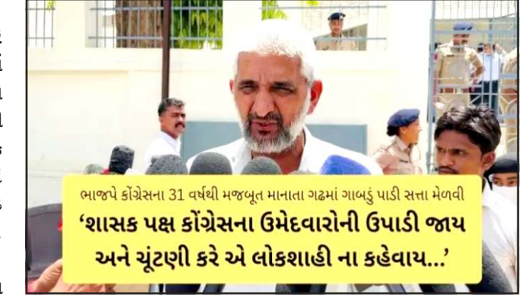
ભાજપે કોંગ્રેસના ૩૧ વર્ષથી મજબૂત માનાતા ગઢમાં ગાબડુ પાડી સત્તા મેળવી 'શાસક પક્ષ કોંગ્રેસના ઉમેદવારોની ઉપાડી જાય અને ચુંટણી કરે એ લોકશાહી ના કહેવાય...'

પ્રતિનિધિ, ગાંધીનગર સત્તાના કાવાદાવા વચ્ચે આખરે અંધાજીના દાંતા તાલુકા પંચાયત માં ભાજપની સત્તા બની છે. કોંગ્રેસ અને ભાજપની ૧૦-૧૦ સીટો આવવાથી ટાઈ પડી હતી, પરંતુ કોંગ્રેસના એક સભ્ય ગેરહાજર રહેતા ભાજપને મોટો ફાયદો થયો અને કોંગ્રેસનો ગઢ કહેવાતા દાંતા તાલુકા પંચાયતને ૩૧ વરસ બાદ ભાજપ કબ્જે કરી છે. બનાસકાંઠા જિલ્લાના દાંતા તાલુકા પંચાયતમાં પ્રમુખ અને ઉપપ્રમુખ પદની ચુંટણીને લઈને આજે સોમવારે ભારે રાજકીય રસાકસી જોવા મળી હતી. ચુંટણી અગાઉ કોંગ્રેસ અને ભાજપ બંને પક્ષો પાસે સમાન ૧૦-૧૦ બેઠકો હોવાથી સત્તા મેળવવા માટે બંને પક્ષોએ જોરદાર પ્રયાસો હાથ ધર્યા હતા. મતદાન પ્રક્રિયા દરમિયાન કુલ ૨૦ સભ્યોમાંથી ૧૯ સભ્યો હાજર રહ્યા હતા. જ્યારે કોંગ્રેસનો એક સભ્ય ગેરહાજર રહેતા પક્ષને મોટો ઝટકો લાગ્યો હતો. કોંગ્રેસના સભ્યની ગેરહાજરીનો સીધો લાભ ભાજપને મળ્યો હતો. આ પરિસ્થિતિમાં ભાજપે કોંગ્રેસના વરસોથી મજબુત મનાતા ગઢમાં ગાબડુ પાડી સત્તા પર કબ્જો જમાવ્યો છે. દાંતા તાલુકા પંચાયતના નવા