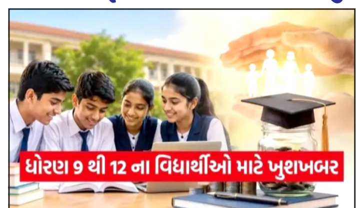
ધોરણ 9 થી 12 ના વિદ્યાર્થીઓ માટે ખુશખબર

વિગતવાર સમજાવે કે આ યોજના શું છે તેના હેઠળ કેટલી આર્થિક મદદ મળે છે, પાત્રતા શું છે અને તેમને તેના માટે કેવી રીતે અરજી કરી શકી છે. પીએમ યશસ્વી યોજના કેન્દ્ર સરકારની એક અત્યંત મહત્વકાંક્ષી શિક્ષણવૃત્તિ યોજના છે. આ યોજનાનું સંચાલન કેન્દ્રીય સામાજિક ન્યાય અધિકારીતા મંત્રાલય દ્વારા કરવામાં આવે છે. આ યોજનાનો મુખ્ય ઉદ્દેશ આર્થિક અને સામાજિક રીતે પછાતવર્ગના તેજસ્વી વિદ્યાર્થીઓને નાણાકીય સહાય પુરી પાડવાનો છે, આ યોજના હેઠળ મળતી સ્કોલરશીપની રકમનો ઉપયોગ વિદ્યાર્થીઓ પોતાની સ્કુલની ફી ભરવા, મોઢા પુસ્તકો ખરીદવા, સ્ટેશનરીનો સામાન લેવા અને ભણતર સાથે જોડાયેલા અન્ય જરૂરી ખર્ચાઓ પુરા કરવા માટે કરી શકે છે. આનાથી પરિવારો પર શિક્ષણનો ભોજ ઓછો થાય છે અને બાળકો કોઈપણ પ્રકારના માનસિક તણાવ વિના અભ્યાસ પુરો કરી શકે છે. આ યોજના સમાજના કેટલાક ખાસ વર્ગોને ધ્યાનમાં રાખીને તૈયાર કરવામાં આવી છે. જેમને મુખ્ય