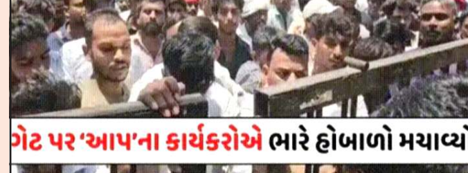
ગેટ પર 'આપ'ના કાર્યકરોએ ભારે હોબાળો મચાવ્યો

અને વિવાદો વચ્ચે યોજાયેલી ચુંટણીમાં ભાજપે વિજય મેળવીને તાલુકા પંચાયત પર ભગવો લહેરાવ્યો હતો. છોટા ઉદેપુર તાલુકા પંચાયતમાં સત્તા ગણિત ખુબ જ રસપ્રદ હતું. છોટા ઉદેપુર તાલુકા પંચાયતમાં કુલ બેઠકોમાંથી આમ આદમી પાર્ટી ૧૩ સભ્યો અને ભારતીય જનતા પાર્ટીના ૧૩ સભ્યો હતા. બંને પક્ષો પાસે સરખા સભ્યો હોવાથી પ્રમુખ પદની ચુંટણીમાં ભારે રસકસી જામી હતી. આમ આદમી પાર્ટીના તમામ ૧૩ સભ્યો જ્યારે મતદાન કરવા માટે કેમ્પસમાં પહોંચ્યા ત્યારે સમગ્ર વિવાદની શરૂઆત થઈ હતી. આમ આદમી પાર્ટીના ચુંટાયેલા સદસ્યોએ ગંભીર આક્ષેપ કરતા જણાવ્યું હતું કે તાલુકા પંચાયત