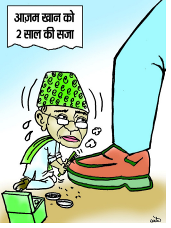
आजम खान को 2 साल की सजा

बेहद खतरनाक है, बल्कि ये अंतरराष्ट्रीय अपराध और आतंक नेटवर्क को भी मजबूत करती हैं। इसके अवैध व्यापार से मिलने वाली रकम का उपयोग कई बार हथियारों की खरीद और अन्य गैरकानूनी गतिविधियों में किया जाता है, जिससे वैश्विक सुरक्षा को खतरा पैदा होता है। भारत में इस तरह की बड़ी खेप की बरामदगी को एजेंसियां एक महत्वपूर्ण सफलता मान रही हैं। एनसीबी अधिकारियों का कहना है कि यह कार्रवाई केवल एक खेप की जब्ती नहीं है, बल्कि पूरे नेटवर्क को समझने और उसे खत्म करने की दिशा में एक बड़ा कदम है। जांच अब इस बात पर केंद्रित है कि यह नेटवर्क भारत में कैसे सक्रिय हुआ, इसके स्थानीय सहयोगी कौन हैं और किन अंतरराष्ट्रीय कड़ियों से इसका संबंध जुड़ा हुआ है। गिरफ्तार किए गए सीरियाई नागरिक से पूछताछ जारी है और एजेंसियां उसके संपर्कों और वित्तीय लेन-देन की जांच कर रही हैं। शुरुआती जांच में यह भी संकेत मिले हैं कि इस नेटवर्क में कई देशों के लोग शामिल हो सकते हैं, जो ड्रग्स की तस्करी को संगठित तरीके से संचालित कर रहे थे। सरकार ने इस कार्रवाई को नशे के खिलाफ अपनी नीति की एक बड़ी उपलब्धि बताया है। अधिकारियों का कहना है कि आने वाले समय में इस तरह के अंतरराष्ट्रीय ड्रग नेटवर्क के खिलाफ और सख्त कार्रवाई की जाएगी और सीमाओं पर निगरानी को और मजबूत किया जाएगा।