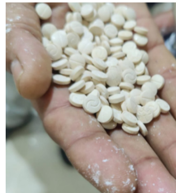
पर साझा करते हुए एनसीबी की टीम की सराहना की। उन्होंने कहा कि केंद्र सरकार का लक्ष्य "ड्रा-फ्री इंडिया" बनाना है और इसके लिए हर स्तर पर सख्त कार्रवाई की जा रही है। उन्होंने बताया कि यह कार्रवाई 'ऑपरेशन रेजिपिल' के तहत की गई, जिसका उद्देश्य अंतरराष्ट्रीय ड्रग नेटवर्क को ध्वस्त करना और भारत को ट्रांजिट रूट के रूप में इस्तेमाल होने से रोकना है।

नई दिल्ली। देश में नशे के खिलाफ चल रहे अभियान के तहत नारकोटिक्स कंट्रोल ब्यूरो (एनसीबी) को एक बड़ी सफलता मिली है। केंद्रीय गृह मंत्री अमित शाह ने जानकारी दी कि एजेंसी ने अंतरराष्ट्रीय स्तर पर फैले ड्रग सिंडिकेट पर बड़ी कार्रवाई करते हुए करीब 182 करोड़ रुपये मूल्य की कैप्टागन ड्रग की खेप जप्त की है। इस ऑपरेशन को नशा तस्करी के खिलाफ अब तक की महत्वपूर्ण कार्रवाइयों में से एक माना जा रहा है, जिसमें लगभग 227.7 किलोग्राम कैप्टागन टैबलेट और पाउडर बरामद किया गया है।