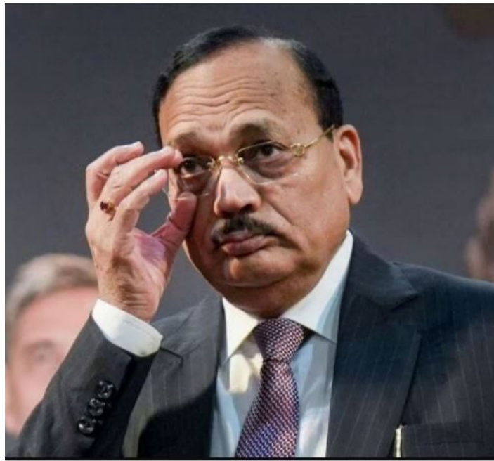
कोशिश करते हैं। अपने बयान में सीजेआई ने स्पष्ट किया कि उन्होंने किसी वर्ग या पीढ़ी को लक्षित नहीं किया है। उन्होंने कहा

दौरान कही गई बात को तोड़-मरोड़कर इस तरह प्रस्तुत किया गया कि जैसे उन्होंने पूरे युवा वर्ग पर टिप्पणी की हो। उन्होंने दोहराया कि उनका उद्देश्य किसी भी स्थिति में युवाओं का अपमान करना नहीं था, बल्कि न्यायिक और पेशेवर व्यवस्था में हो रही अनियमितताओं पर चिंता व्यक्त करना था।