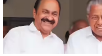
थी और वे मुख्यमंत्री पद की दौड़ में मजबूत दावेदार माने जा रहे थे। वहीं विपक्ष के नेता रहे वी.डी. सतीशन को संगठन और आलाकमान के भीतर प्रभावशाली समर्थन प्राप्त था। कई दौर की बैठकों और मंथन के बाद आखिरकार कांग्रेस आलाकमान ने सतीशन के नाम पर अंतिम मुहर लगा दी।

कोच्चि। केरल कांग्रेस में पिछले कई दिनों से चल रहे नेतृत्व संघर्ष और अंदरूनी खींचतान के बाद अब पार्टी ने सार्वजनिक रूप से एकजुटता का संदेश देने की कोशिश शुरू कर दी है। मुख्यमंत्री पद के लिए चुने गए वी.डी. सतीशन और एआईसीसी महासचिव के.सी. वेणुगोपाल की तिरुवनंतपुरम में हुई मुलाकात को कांग्रेस के लिए बेहद महत्वपूर्ण राजनीतिक घटनाक्रम माना जा रहा है। नेतृत्व की दौड़ में चली लंबी रस्साकशी और आखिरी क्षण तक बने संश्लेष के बाद यह पहली बार था जब दोनों वरिष्ठ नेता खुलकर साथ नजर आए। कांग्रेस नेतृत्व इस मुलाकात के जरिए यह संदेश देना चाहता है कि मुख्यमंत्री चयन को लेकर पार्टी के भीतर जो मतभेद दिखाई दे रहे थे, अब उन्हें पीछे छोड़ दिया गया है और पूरा संगठन नई सरकार के गठन तथा प्रशासनिक कामकाज पर ध्यान केंद्रित कर रहा है।