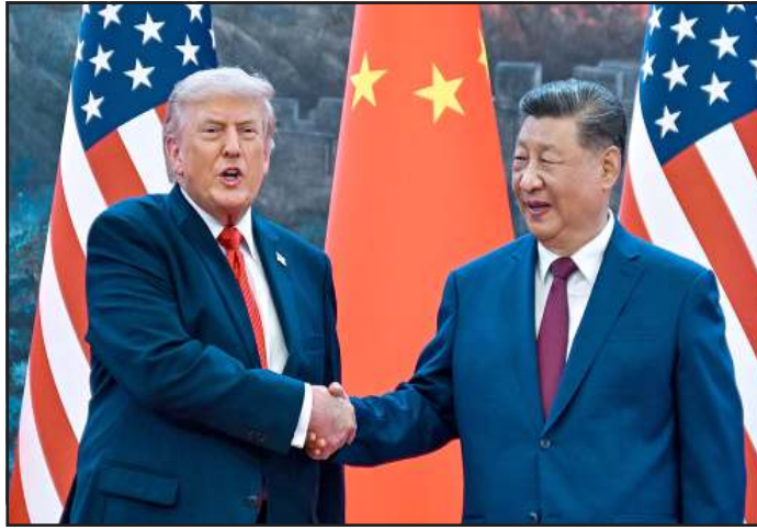
માનવામાં આવી રહી છે. શી જિનપિંગે વિશ્વની વર્તમાન સ્થિતિ અંગે વાત કરતા જણાવ્યું હતું કે ટ્રમ્પ આજે એક એવા સ્થાને પહોંચી છે

ચીનના રાષ્ટ્રપ્રમુખ શી જિનપિંગે લાલ જાજમ બિછાવીને ટ્રમ્પનું ઉષ્માભર્યું અભિવાદન કર્યું, જે બંને દેશો વચ્ચે બદલાતા સમીકરણોનો સંકેત આપે છે (સંપૂર્ણ સમાચાર સેવા) નવી દિલ્હી વિશ્વની બે સૌથી મોટી મહાસત્તાઓ વચ્ચેના સંબંધોમાં એક નિર્ણાયક વળાંક આવ્યો છે. અમેરિકન પ્રમુખ ડોનાલ્ડ ટ્રમ્પ તેમના બે દિવસીય ઐતિહાસિક પ્રવાસે ચીન પહોંચ્યા છે, જ્યાં બેઈજિંગના પ્રતિષ્ઠિત ‘ગ્રેટ હોલ ઓફ ધ પીપલ’ ખાતે તેમનું સ્વાગત કરવામાં આવ્યું હતું. ચીનના રાષ્ટ્રપ્રમુખ શી જિનપિંગે લાલ જાજમ બિછાવીને ટ્રમ્પનું ઉષ્માભર્યું અભિવાદન કર્યું, જે બંને દેશો વચ્ચે બદલાતા સમીકરણોનો સંકેત આપે છે. બંને નેતાઓ વચ્ચે અનેક મહત્વના મુદ્દાઓ પર ચર્ચા થઈ હતી.