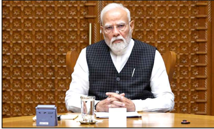
આનાથી લોકોનો મુસાફરીનો સમય બચશે અને તેઓ એક જ દિવસમાં સરળતાથી આવ-જા કરી શકશે. આ ૧૩૪ કિલોમીટર લાંબી રેલ લાઈન અમદાવાદ જિલ્લાના ૨૮૪ ગામોને સીધા જોડશે. આનાથી આશરે ૫ લાખ

૩.૨૦૬૬૭ કરોડના ખર્ચે દેશનો પહેલો સેમી-હાઈ-સ્પીડ રેલ પ્રોજેક્ટ અને કોલસામાંથી ગેસ બનાવવા ૩.૭૭૫૦૦ કરોડના પ્રોજેક્ટને લીલી ઝંડી ગુજરાત માટે સૌથી રોમાંચક સમાચાર એ છે કે હવે અમદાવાદથી ધોલેરા વચ્ચે ટ્રેનની મુસાફરી ખૂબ જ ઝડપી અને હાઈ-ટેક બનશે. આ પ્રોજેક્ટ વિશે માહિતી આપતા કેન્દ્રીય મંત્રી અશ્વિની વેણવે જણાવ્યું હતું કે, આ ભારતીય રેલવેનો દેશનો આવો પહેલો સેમી-હાઈ-સ્પીડ પ્રોજેક્ટ હશે, જે સંપૂર્ણપણે આપણી સ્વદેશી ટેકનોલોજીથી તૈયાર થશે. આ નવી રેલ લાઈન અમદાવાદને ધોલેરા SIR, નવા બની રહેલા ધોલેરા એરપોર્ટ અને લોથલાના નેશનલ મેરીટાઈમ હેરિટેજ કોમ્પ્લેક્સ સાથે સીધું જોડી દેશે.