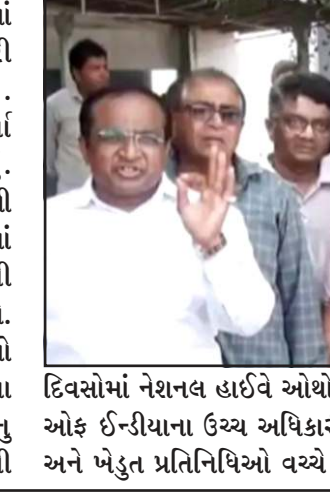
દિવસોમાં નેશનલ હાઈવે ઓથોરીટી ઓફ ઈન્ડિયાના ઉચ્ચ અધિકારીઓ અને ખેડુત પ્રતિનિધિઓ વચ્ચે એક

વિરોધ અને હોબાળાને જોતા હાલમાં સર્વિસ રોડની તમામ કામગીરી અટકાવી દેવામાં આવી છે. અધિકારીઓને કોઈપણ કામ કર્યા વિના જ પરત ફરવું પડ્યું હતું. ખેડુતોએ સ્પષ્ટ ચેતવણી આપી હતી કે જો તેમના હિતમાં નિષ્ણય લેવામાં નહી આવે તો તેઓ આગામી સમયમાં આંદોલન વધુ ઉગ્ર બનાવશે. આ ઘટના બાદ તંત્ર અને ખેડુતો વચ્ચે મડાગાંઠ સર્જાઈ છે. સુત્રોના કહેવા પ્રમાણે વળતરના પ્રશ્નોનું નિરાકરણ લાવવા માટે આગામી