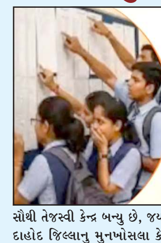
સૌથી તેજસ્વી કેન્દ્ર બન્યું છે, જ્યારે દાહોદ જિલ્લાનું મુનખોસલા કેન્દ્ર

છે. પરીણામના આંકડા જોતા સ્પષ્ટ થાય છે કે આ વખતે પણ દિકરીઓએ મેદાન માર્યું છે, વિદ્યાર્થીઓનું પરીણામ ૮૦.૧૨ ટકા રહ્યું છે, જેની સામે વિદ્યાર્થીનીઓએ ૮૮.૨૮ ટકા સાથે ઉચ્ચ પ્રદર્શન કર્યું છે, જિલ્લાવાર વાત કરીએ તો નર્મદા જિલ્લા ૮૦.૮૫ ટકા સાથે રાજ્યમાં પ્રથમ ક્રમે રહ્યો છે. જ્યારે પંચમહાલ જિલ્લા ૭૬.૪૨ ટકા સાથે અંતિમ ક્રમે છે, કેન્દ્ર અને શાળાવાર પરીણામની જો વાત કરીએ તો ગાંધીનગર જિલ્લાનું આજોલ કેન્દ્ર ૧૦૦ ટકા પરીણામ સાથે રાજ્યનું