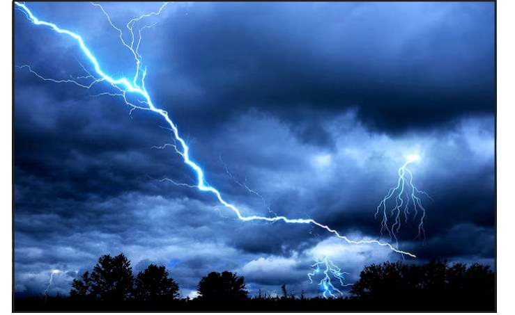
હળવાથી મધ્યમ વરસાદ સાથે ૩૦થી વધુ કિલોમીટર પ્રતિ કલાકની ઝડપે પવન ફૂંકાઈ શકે છે. વાદળ અને છૂટક વરસાદને કારણે આ વિસ્તારોમાં તાપમાન નિયંત્રિત રહેવાની શક્યતા છે.

અતિશય પવન, વરસાદ અને વીજળી પડવાના બનાવોમાં ૨ બાળકો સહિત ૧૨ લોકોના મોત થયા છે