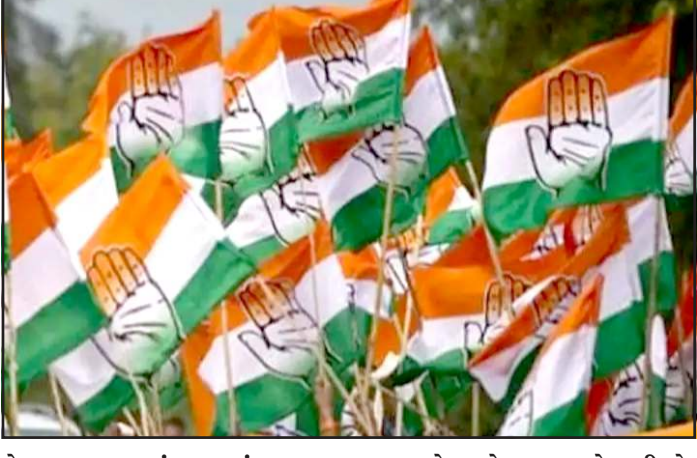
મેઘરજ તાલુકા પંચાયતમાં કુલ ૨૨ ૧૦ અને ૧ બેઠક અપક્ષને મળી છે. બેઠકોમાંથી કોંગ્રેસને ૧૧, ભાજપને અપક્ષ ઉમેદવારના સમર્થનથી

પ્રતિનિધિ, ગાંધીનગર અરવલ્લી જિલ્લામાં સ્થાનિક સ્વરાજ્યની ચુંટણીઓના પરીણામ જાહેર થતા રાજકીય વાતાવરણ ગરમાયુ છે અને વિવિધ તાલુકા પંચાયતોમાં સત્તા સ્થાપવા માટે રાજકીય કવાયત તેજ બની છે. મળતી માહિતી અનુસાર જિલ્લાના ભિલોડા અને શામળાજી તાલુકા પંચાયતમાં કોંગ્રેસ પક્ષે સ્પષ્ટ બહુમતી હાસલ કરીને સત્તાના દ્વાર ખોલી દીધા છે. જ્યારે મેઘરજ અને મોડાસા તાલુકા પંચાયતોમાં રસાકસીભરી સ્થિતિ સર્જઈ છે.