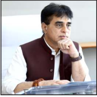
નોંધાતા પોલીસ તંત્ર ધંધે લાગી ગયું હતું. આરોગ્યમંત્રી પ્રફુલ પાનસેરીયા સુરતમાં પોતાની કારમાં રોડ પર જઈ રહ્યા હતા. ત્યારે રોડ પર એક રેતી-પથ્થર ભરેલ ડમ્પર પસાર થતા

પ્રતિનિધિ, ગાંધીનગર આપણું પોલીસતંત્ર આમ આદમી કરતા નેતાઓની વધુ સંભાળ રાખે છે, રોડ રસ્તા પર વાહનો પસાર થાય તો લોકો રોજ ધુળ ખાતા હોય છે, વાહનો પસાર થાય તો લોકો રોજ ધુળની ડમરીઓ ખાતા હોય છે, વાહનોમાંથી કાંકરી ખરે ને લોકોને વાગે તો તેની નોંધ નથી લેવાતી, પણ સુરતના આરોગ્યમંત્રી જ્યારે કારમાં પસાર થઈ રહ્યા હતા, ત્યારે એક ડમ્પર તેમની કાર પાસેથી પસાર થતા ડમ્પરમાં ભરેલ રેતી-પથ્થર મંત્રીની કાર પર પડતા અને કારને નુકશાન થતા આ મામલે પોલીસ ફરીયાદ