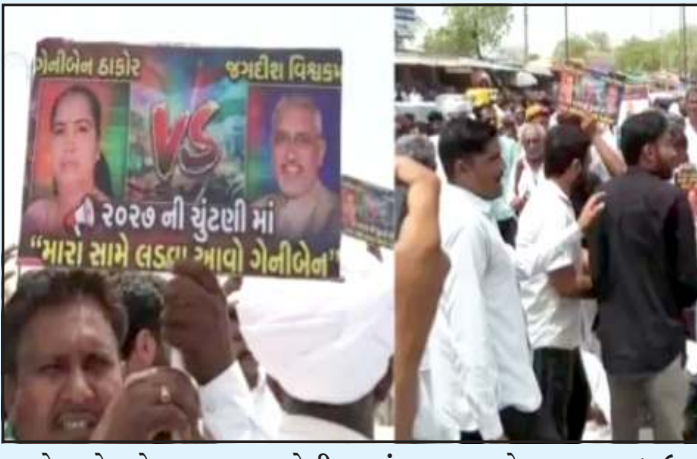
આગેવાનો જોડાયા હતા. રેલી દરમિયાન ભાજપના પ્રદેશ પ્રમુખના પુતળાનું દહન કરવાનો પ્રયાસ કરવામાં આવતા જેનાથી સ્થિતિ વધુ તંગ બની ગઈ હતી. પુતળા દહન દરમિયાન પોલીસે તાત્કાલીક હસ્તક્ષેપ કરી કાર્યકરો પાસેથી પુતળા ઈનવી લીધું હતું. આ ઘટનાએ વાતાવરણ વધુ ઉગ્ર બનાવી દીધું હતું. કોંગ્રેસના કાર્યકરો અને પોલીસ વચ્ચે સામાન્ય ઘર્ષણ સર્જાયું હતું. સ્થિતિ કાબુમાં લેવા પોલીસે કેટલાક કાર્યકરોની અટકાયત પણ કરી હતી. સમગ્ર ઘટનાએ વિસ્તારના રાજકીય તાપમાનને વધારી દીધું હતું.