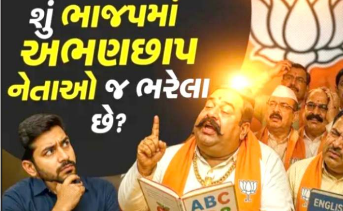
અને કામ કરવાની ઉત્તમ ક્ષમતા છે, આથી ઓછો અભ્યાસ વહિવટી કાર્યમાં કોઈપણ પ્રકારે બાધારૂપ બનશે નહીં.

એક જીયુએટ છે, ચુંટાયેલા નગરસેવકોના અભ્યાસને લઈને કોંગ્રેસ હવે સવાલો ઉઠાવ્યા છે, કોંગ્રેસ શહેર પ્રમુખે નિવેદન આપતા જણાવ્યું હતું કે આટલું ઓછું ભણેલા નગરસેવકો મનપાનો કરોડો રૂપિયાનો વહિવટ કરી રીતે સંભાળશે ? તો બીજી તરફ શહેર ભાજપ પ્રમુખે નગરસેવકોના અભ્યાસ અંગે પ્રતિક્રિયા આપતા જણાવ્યું હતું કે ઘણા કોર્પોરેટરો ઉચ્ચ શૈક્ષણિક લાયકાત ધરાવે છે. બીજું કે, જે નગરસેવકો વધુ અભ્યાસ કરી શક્યા નથી તેમની પાસે બહોળો અનુભવ