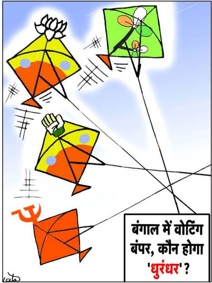
બંગાળ મેં વોટિંગ બંપર, કૌન હોગા 'ધુરંધર'?

બંગાળમાં ૯૩ ટકા વોટિંગ છતાં ફાલ્ટા બેઠક પર ફરી થશે મતદાન (સંપૂર્ણ સમાચાર સેવા)કોલકાતા પશ્ચિમ બંગાળની ફાલ્ટા વિધાનસભા બેઠક પર ૨૯ એપ્રિલના રોજ થયેલા મતદાન દરમિયાન લોકશાહી પ્રક્રિયાનું ઉલ્લંઘન અને ગંભીર ચૂંટણી અપરાધોની ઘટનાઓ સામે આવી હતી. આ બાબતને ગંભીરતાથી લેતા ચૂંટણી પંચે આખી બેઠક પર નવેસરથી મતદાન કરાવવાનો નિર્ણય લીધો છે. ચૂંટણી પંચ દ્વારા જાહેર કરવામાં આવેલા આદેશ મુજબ ફાલ્ટા બેઠક માટે નવું શેડ્યુલ અનુસાર સહાયક મતદાન મથકો સહિત તમામ ૨૮૫ મથકો પર ફરીથી મતદાન થશે. ૨૧ મે ૨૦૨૬ ના રોજ ફરીથી મતદાન યોજાશે. સવારે ૭ થી સાંજના ૬ વાગ્યા સુધી મતદાન થશે. આ બેઠક માટે ૨૪ મે ના રોજ મતગણતરી કરવામાં આવશે. દક્ષિણ ૨૪ પરગણા જિલ્લાના આ મતવિસ્તારમાં ૨૯ એપ્રિલના મતદાન બાદ સ્થાનિક લોકોએ વ્યાપક વિરોધ પ્રદર્શન કર્યા હતા. ખાસ કરીને હાસીમનગર ગામમાં તજાવ વધ્યો હતો. જ્યાં મોટી સંખ્યામાં ગ્રામીણો અને ભાજપના સમર્થકોએ રસ્તા જામ કરીને સુરક્ષા અને ફરીથી મતદાનની માંગ કરી હતી. લોકોના આકોશ અને સુરક્ષાની માંગ બાદ CRPF ના જવાનોને મોટી સંખ્યામાં તૈનાત કરવામાં આવ્યા હતા. પશ્ચિમ બંગાળમાં આ વખતે બે તબક્કામાં યોજાયેલી વિધાનસભા ચૂંટણીમાં આઝાદી પછીનું સૌથી વધુ, અંદાજે ૯૩ ટકા જેટલું સરેરાશ મતદાન નોંધાયું છે.