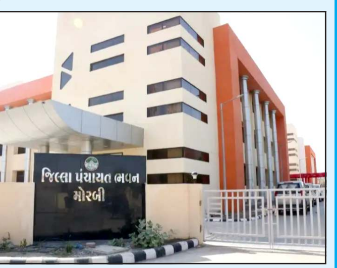
જિલ્લા પંચાયત ભવન મોરબી

પ્રતિનિધિ, ગાંધીનગર મોરબી જિલ્લા પંચાયત ચુંટણી જંગ ભાજપે જીતી લીધો છે. પોતાનો ગઠ જાળવી રાખવામાં ભાજપને સફળતા મળી છે, જિલ્લા પંચાયતની ૨૪ માં થી ૧૭ બેઠકો જીતી બહુમતી હાંસલ કરી લીધી છે. અને કોંગ્રેસને ફાળે માત્ર ૭ બેઠકો રહી છે, પરંતુ કોંગ્રેસના ૭ જ સદસ્ય હોવા છતાં પ્રમુખ પદ કોંગ્રેસને ફાળે જાય તેવી સ્થિતિનું નિર્માણ થયુ છે.