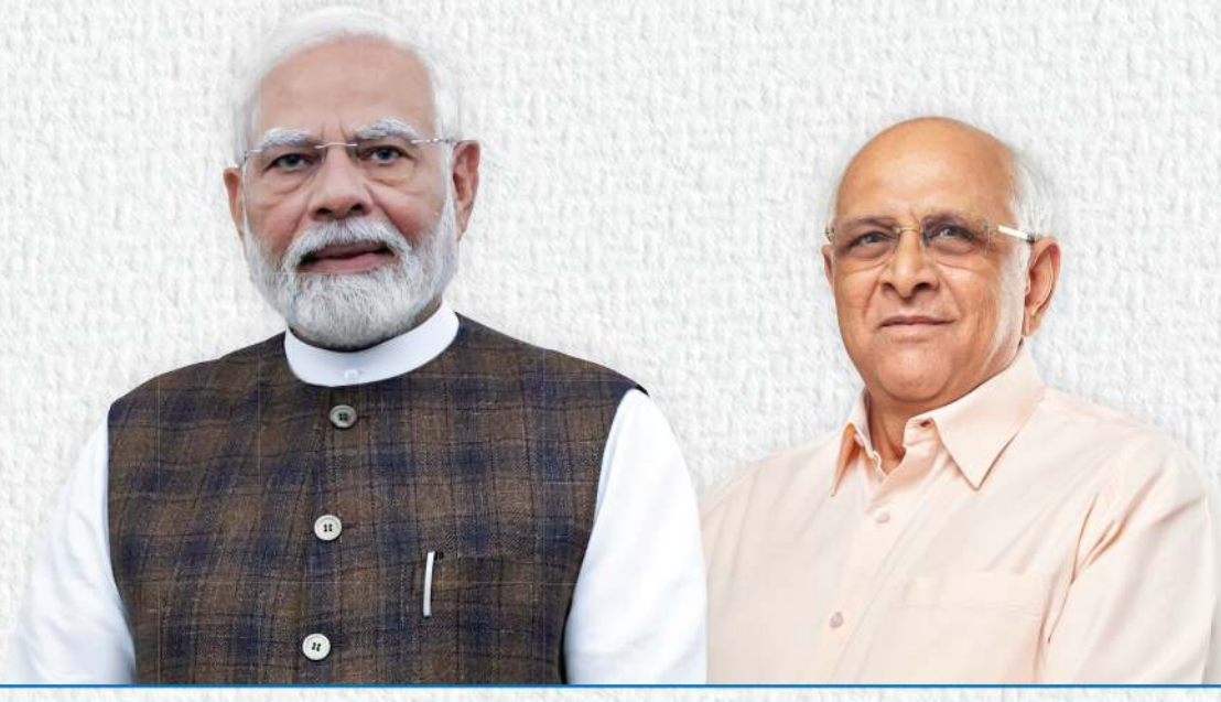
શ્રી નરેન્દ્ર મોદી માનનીય વડાપ્રધાન