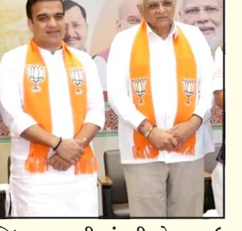
માળખામાં પણ જરૂરી ફેરફારો અંગે ચર્ચા થવાની શક્યતા છે. ભાજપ દ્વારા આગામી એક અઠવાડીયાની અંદર તમામ મહત્વના હોદદારોની નિમણૂક પ્રક્રિયા પૂર્ણ કરી લેવાની યોજના છે. એકવાર નામો નક્કી થયા બાદ નવા હોદદારો વિધિવત રીતે પોતાનો કાર્યભાર સંભાળશે. આ નિર્ણયને પગલે રાજ્યના રાજકીય વર્તુળોમાં ભારે ઉત્તેજના જોવા મળી રહી છે. કારણ કે આ નિમણૂકો આગામી પાંચ વર્ષ માટે સ્થાનિક શાસનનુ ભવિષ્ય નક્કી કરશે. સમગ્ર રાજ્યમાં ભાજપના શાસન હેઠળની મહાનગરપાલિકાઓ અને નગરપાલિકાઓમાં કોણ સુકાન સંભાળશે તેના પર સૌની નજર ટકેલી છે. કમલમ ખાતે લેવાનારો આ નિર્ણય માત્ર વહિવટી જ નહી પરંતુ વ્યુહાત્મક રીતે પણ મહત્વનો માનવામાં આવે છે. આ પ્રક્રિયા પૂર્ણ થયા બાદ વિકાસના કામોમાં ઝડપ આવશે અને નવા ચુંટાયેલા પ્રતિનિધિઓ જનતાના પ્રશ્નોના ઉકેલ માટે સક્રિય થશે.

પ્રતિનિધિ, ગાંધીનગર સ્થાનિક સ્વરાજ્યની ચુંટણીમાં ભારતીય જનતા પાર્ટીની ભવ્ય જીત બાદ હવે સંગઠનાત્મક માળખાને મજબુત કરવાની કવાયત તેજ બની ગઈ છે. આ અંતર્ગત ગાંધીનગર સ્થિત પ્રદેશ ભાજપ કાર્યાલય કમલમ ખાતે બેઠકોનો ધમધમાટ શરૂ થઈ ગયો છે. ચુંટણીના પરીણામો જાહેર થયા બાદ પાર્ટી હવે વિવિધ શહેરો અને જિલ્લાઓમાં મહત્વના હોદાઓ પર નિમણૂક કરવા માટે ગંભીરતાથી વિચારણા કરી રહી છે. આ મહત્વપૂર્ણ બેઠકોમાં મુખ્યત્વે મેયર અને સ્ટેન્ડિંગ કમિટીના ચેરમેન જેવા પ્રતિષ્ઠિત હોદાઓ માટેના નામો પર ચર્ચા કરવામાં આવશે. આ પ્રક્રિયામાં મુખ્યમંત્રી, નાયબ મુખ્યમંત્રી અને પ્રદેશ પ્રમુખની પ્રત્યક્ષ હાજરીમાં વિગતવાર મંથન હાથ ધરવામાં આવશે. પાર્ટીનો ઉદ્દેશ એવા ચહેરાઓની પસંદગી કરવાનો છે. જે સ્થાનિક સ્તરે મજબુત નેતૃત્વ પુરૂ પાડી શકે તેમજ આવનારી