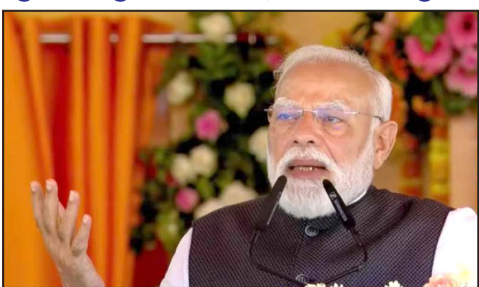
હોત તો ૨૦૨૦ની ચૂંટણીઓથી લોકસભામાં અનામત મળત. મોદી સંખ્યામાં અમારી માતાઓ અને બહેનો મહિલાઓને વિધાનસભા અને

જરાય પસંદ નથી આવતી. તેઓ એક વાર ફરી યુપીને જૂના સમયમાં ધકેલવા માંગે છે અને રાજ્યને જાતિમાં વહેંચવા માંગે છે. સમાજવાદી પાર્ટી વિકાસ વિરોધી તેમજ મહિલા વિરોધી પણ છે. તેથી જ તેણે સંસદમાં મહિલાઓના અધિકારના બિલને પાસ થવા દીધું ન હતું." પીએમ મોદીએ કહ્યું કે, તાજેતરમાં જ દેશના લોકોએ એક વાર ફરી સમાજવાદી પાર્ટી અને કોંગ્રેસનો અસલી ચહેરો જોયો છે. કેન્દ્ર સરકાર સંસદમાં નારી શક્તિ વંદન સંશોધન બિલ લાવી જો આ બિલ પાસ થઈ ગયું