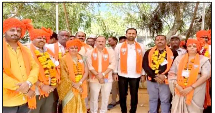
થયેલા પરીણામોમાં મુખ્યત્વે ભારતીય જનતા પાર્ટીનુ પ્રભુત્વ જોવા મળ્યુ છે. મતગણતરી સુચારૂ આયોજન સાથે પૂર્ણ થઈ હતી. જિલ્લામાં જિલ્લા પંચાયતની ૩૪, તાલુકા પંચાયતની ૧૯૦ અને અમરેલી, બાબરા, સાવરકુંડલા, ધારી, ભગસરા અને દામનગર

પ્રતિનિધિ, ગાંધીનગર સૌરાષ્ટ્રના રાજકારણના એપી સેન્ટર ગણાય છે તેવા અમરેલી જિલ્લામાં સ્થાનિક સ્વરાજ્યની ચુંટણીમાં જિલ્લા પંચાયત, તાલુકા પંચાયત અને નગરપાલિકાઓમાં ભાજપનો દબદબો રહેવા પામ્યો છે. જિલ્લાની ૧૧ તાલુકા પંચાયતમાં ૯ તાલુકા પંચાયતમાં ભાજપ અને એક પર કોંગ્રેસ તેમજ એક પર આમ આદમી પાર્ટીનુ શાસન આવ્યું છે. સ્થાનિક સ્વરાજ્યની ચુંટણીમાં અમરેલી જિલ્લામાં મતગણતરી પ્રક્રિયા શાંતિપૂર્ણ માહોલમાં સફળતાપૂર્વક પૂર્ણ થઈ હતી. જિલ્લા પંચાયત, તાલુકા પંચાયત તેમજ ૬ નગરપાલિકાઓની બેઠકો માટે જાહેર