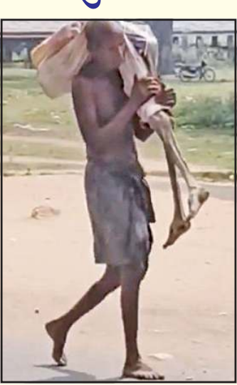
દીયાનાલી ગામના રહેવાસી છે, તેમની ૫૬ વર્ષીય બહેન કલરા મુંડાનું ઓડિશા ગ્રામીણ બેન્કમાં ખાતું હતું,

(સંપૂર્ણ સમાચાર સેવા)ભુવનેશ્વર ઓડિશાનો એક વીડિયો સોશિયલ મીડિયા પર ખુબ વાયરલ થઈ રહ્યો છે, વીડિયોમાં એક આદિવાસી પોતાની બહેનનું હાડપિંજર ખભા પર ઉચકીને લઈ જતો જોવા મળ્યો હતો. બહેનનું ગ્રામીણ બેન્કમાં ખાતું હતું જેમાં ૧૮૦૦૦ રૂપિયા જમા હતા, બેન્કવાળા પુરાવા માગી રહ્યા હતા અને દોડાવી રહ્યા હતા તેથી ભાઈ પોતાની મૃત બહેનનું હાડપિંજર લઈને બેન્ક પહોંચી ગયો હતો. આ સમગ્ર ઘટનાને લઈને લોકો વ્યવસ્થા પર સવાલો ઉઠાવી રહ્યા છે. ૫૦ વર્ષના જુનું મુંડા ઓડિશાના કેઓનજાહરના