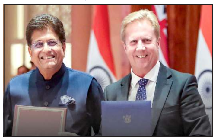
કરવામાં આવ્યો છે, જેમાં દર વર્ષે 1000 ભારતીય યુવાનો 1૨ મહિના માટે ન્યૂઝીલેન્ડમાં મહિવલ એન્ટ્રી કરી શકશે.

આવેલા પોસ્ટ-સ્ટડી વર્ક વિઝાનો લાભ પણ મળશે. કુશળ વ્યાવસાયિકો માટે તક : ઊંચા પગારવાળી નોકરી ઈચ્છતા કૌશલ્ય ધરાવતા ભારતીય વ્યાવસાયિકો માટે ૫૦૦૦ કામચલાઉ રોજગાર વિઝાનો વિશેષ કોટા નક્કી કરવામાં આવ્યો છે. આ વિઝા દ્વારા વ્યાવસાયિકો ત્રણ વર્ષ સુધી ન્યૂઝીલેન્ડમાં રહીને નોકરી કરી શકશે. વર્કિંગ હોલિડે પ્રોગ્રામ : આ સમજૂતી હેઠળ એક વિશેષ 'વર્કિંગ હોલિડે વિઝા' કાર્યક્રમ પણ શરૂ