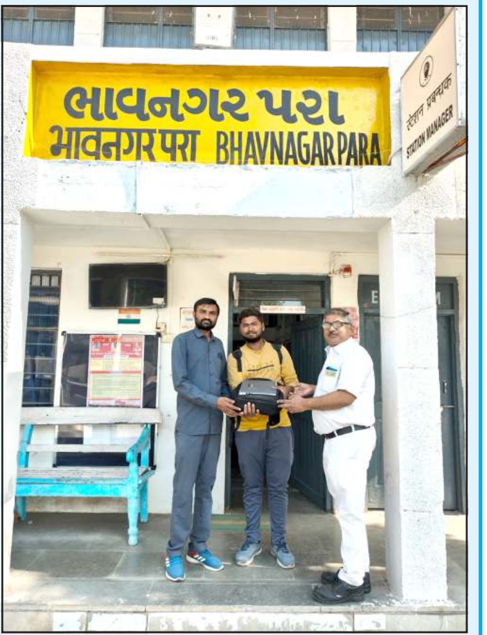
પોર્ટન્ટ્સમેનની પ્રશંસા કરીને તેમને પ્રોત્સાહિત કર્યાં. ભાવનગર મંડળ ઘટનાઓ રેલવે કર્મચારીઓની સુસાફરોની સુવિધા અને સુરક્ષા પ્રત્યે સતર્કતા અને સેવાભાવને દર્શાવે છે.