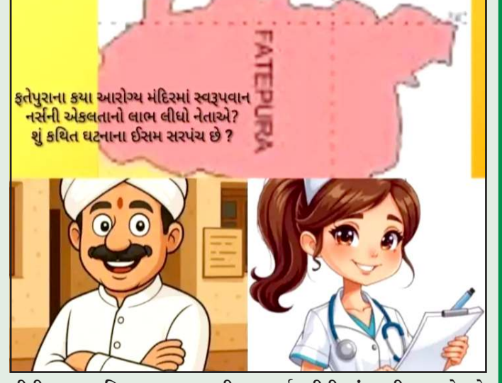
ફતેપુરા કયા આરોગ્ય મંદિરમાં સ્વરૂપવાન નર્સની એકલતાનો લાભ લીધો નેતાએ? શું કથિત ઘટનાના ઈસમ સરપંચ છે ?

તાલુકાની કાર્યવાહીની માંગ કરી રહ્યા છે. જો કે આ કરોડપતિ નેતા પૈસા અને પાવરના જોરે કુદતા હોઈ મહિલા કઈ નહીં કરે તેવી શેખીમાં રાચી રહ્યા છે. આથી આગામી દિવસોમાં મોટો ઘટસ્ફોટ થાય તેવી શક્યતા છે.