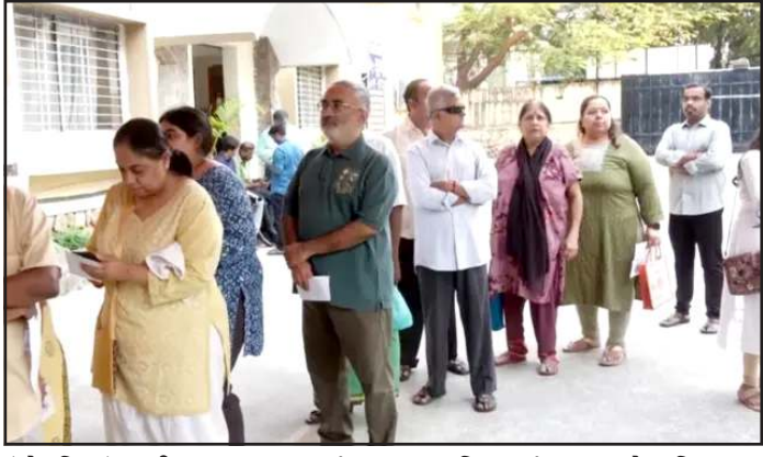
અમેરિકામાં મિડ-ટર્મ ચૂંટણીમાં મોટા ઉલટફેરના અંધાણ!

(સંપૂર્ણ સમાચાર સેવા)વોશિંગ્ટન અમેરિકામાં યોજાનારી આગામી મિડ-ટર્મ ચૂંટણીઓ પહેલા રાષ્ટ્રપ્રમુખ ડોનાલ્ડ ટ્રમ્પના શ્રદ્ધામાં મોટો ઘટાડો નોંધાયો છે. રોઈટર-ઈપ્સોસ, વેરાસાઈટ અને AP-NORC દ્વારા કરવામાં આવેલા તાજેતરના પોલ્સ દર્શાવે છે કે, ટ્રમ્પનું એપ્રૂવલ રેટિંગ ઘટીને ૩૩%થી ૩૬%ની વચ્ચે આવી ગયું છે, જે તેમના અત્યાર સુધીના સૌથી નીચલા સ્તરો પૈકીનું એક છે. AP-NORCના સર્વે મુજબ, ૧૦માંથી ૭ અમેરિકનો માને છે કે ટ્રમ્પનું અર્થતંત્ર નબળું છે અને દેશ ખોટી દિશામાં આગળ વધી રહ્યો છે. ટ્રમ્પના અર્થતંત્ર પ્રત્યેના નિર્ણયોને માત્ર ૩૦% લોકોએ જ સમર્થન આપ્યું છે, જે માર્ચમાં ૩૮% હતું. જીવનનિર્વાહના ખર્ચ (Cost of Living) મુદ્દે ૭૬% લોકોએ અસંતોષ વ્યક્ત કર્યો છે, જ્યારે માત્ર ૨૩% લોકો ટ્રમ્પની કામગીરીથી સંતુષ્ટ છે. ટ્રમ્પની કડક ડિપોઝિશન પોલિસી હવે તેમની જ પાર્ટી માટે જોખમી સાબિત થઈ શકે છે. ૫૨% અમેરિકનોએ જણાવ્યું કે, તેઓ એવા ઉમેદવારને મત નહીં આપે જે ટ્રમ્પની ડિપોઝિશન નીતિનું સમર્થન કરતા હોય. ખાસ કરીને ઈન્ડિપેન્ડન્ટ મતદારોમાં આ વિરોધ વધુ જોવા મળ્યો છે. મિનેસોટામાં વિરોધ પ્રદર્શનો દરમિયાન થયેલા મૃત્યુ બાદ વલીવોટીંગને અટકાવતી પ્રક્રિયા ધીમી કરી છે. વિદેશ નીતિના મોરચે પણ ટ્રમ્પને મુશ્કેલીનો સામનો કરવો પડી રહ્યો છે. ૬૭% અમેરિકનોએ ઈરાન સાથેના સંઘર્ષના મુદ્દે ટ્રમ્પના વલણને નકારી દીધું છે. સર્વે મુજબ, ૬૧% અમેરિકનો માને છે કે અમેરિકાએ ઈરાનમાં હવે વધુ કોઈ સૈન્ય કાર્યવાહી કરવી જોઈએ નહીં. જોકે, આ નકારાત્મક પોલ્સ વચ્ચે પણ મિનેસોટામાં વિરોધ પ્રદર્શનો દરમિયાન થયેલા મૃત્યુ બાદ વલીવોટીંગને અટકાવતી પ્રક્રિયા ધીમી કરી છે. આ ઉપરાંત, વોટર આઈડી અને નાગરિકતાના પુરાવા ફરજિયાત કરવાના મુદ્દે ૭૫% અમેરિકનો ટ્રમ્પની તરફેણમાં છે.