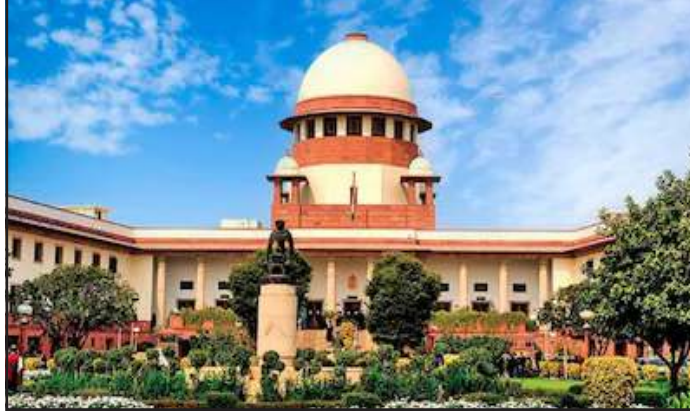
શકશે. નેશનલ હાઈવે ઓથોરિટી ઓફ ઈન્ડિયા (NHAI), રાજ્ય

હવે વાહનો માત્ર નિર્ધારિત પાર્કિંગ ઝોન જગ્યાઓ પર જ ઊભા રહી શકશે : નિર્ણય રોડ અકસ્માતોમાં ઘટાડો માટે લેવાયો