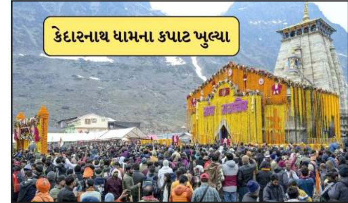
કેદારનાથ ધામના કપાટ ખુલ્યા

કેદારનાથ ધામને બાર જ્યોતિર્લિંગમાંથી અગિયારમા તરીકે પૂજવામાં આવે છે, એવું માનવામાં આવે છે કે ભગવાન શિવ પોતે જ્યોતિર્લિંગના રૂપમાં રહે છે