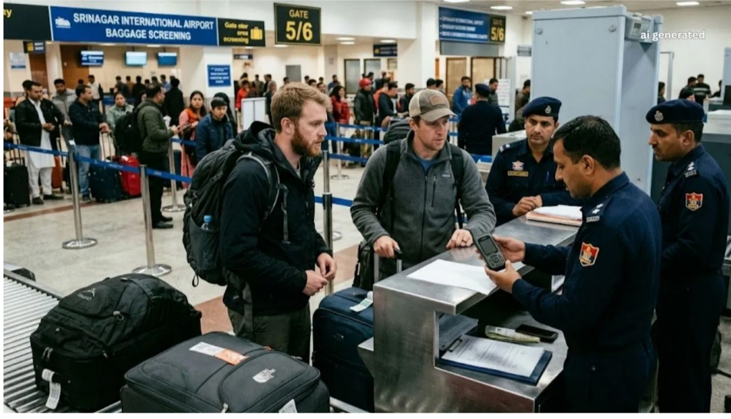
और क्या उन्होंने इसके लिए भारत सरकार से आवश्यक अनुमति ली थी या नहीं। भारत में सैटेलाइट फोन या किसी भी प्रकार के स्वतंत्र संचार उपकरण के उपयोग के लिए दूरसंचार विभाग से पूर्व अनुमति लेना अनिवार्य

यही कारण है कि ऐसे डिवाइस सुरक्षा एजेंसियों के लिए चिंता का विषय बन जाते हैं। प्रारंभिक जांच में सामने आया है कि बरामद डिवाइस एक उन्नत सैटेलाइट कम्युनिकेशन उपकरण है, जिसे बिना अनुमति भारत में रखना कानूनन प्रतिबंधित है। ऐसे उपकरणों का इस्तेमाल आमतौर पर उन क्षेत्रों में किया जाता है, जहां मोबाइल नेटवर्क उपलब्ध नहीं होता, लेकिन संवेदनशील इलाकों में इनका दुरुपयोग अवैध संचार या संदिग्ध गतिविधियों के लिए भी किया जा सकता है। घटना के तुरंत बाद दोनों विदेशी नागरिकों को हिरासत में लेकर पुलिस के हवाले कर दिया गया। अब उनसे पूछताछ की जा रही है, ताकि यह पता लगाया जा सके कि उनके पास यह डिवाइस किस उद्देश्य से था