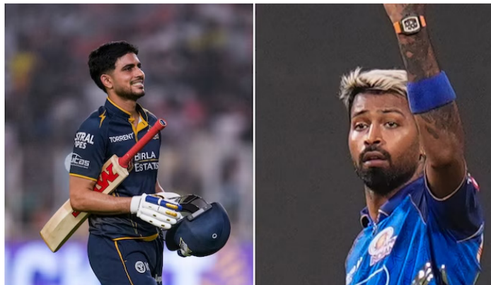
क्रम में निरंतरता की कमी सबसे बड़ी आفة। शीर्ष क्रम में Rohit Sharma की चोट ने टीम की मुश्किलें और बढ़ा दी हैं, जिससे बल्लेबाजी की जिम्मेदारी

अपनी स्थिति और मजबूत करना। कप्तान Shubman Gill की अगुवाई में टीम ने हाल के मैचों में जिस तरह संतुलित प्रदर्शन किया है, उसने उन्हें एक खतरनाक इकाई बना दिया है। खासकर बल्लेबाजी में गिल के साथ साई सुदर्शन और Jos Buttler की मौजूदगी विपक्षी गेंदबाजों के लिए बड़ी चुनौती बन रही है। इन खिलाड़ियों ने न केवल रन बनाए हैं, बल्कि मुश्किल हालात में पायी को संभालने की जिम्मेदारी भी निभाई है। इसके उलट मुंबई इंडियंस का हाल कुछ अलग कहानी बयान करता है। Hardik Pandya की कप्तानी में टीम ने सीजन की शुरुआत तो जीत के साथ की, लेकिन उसके बाद लगातार चार हार ने टीम का संतुलन बिगाड़ दिया है। बल्लेबाजी