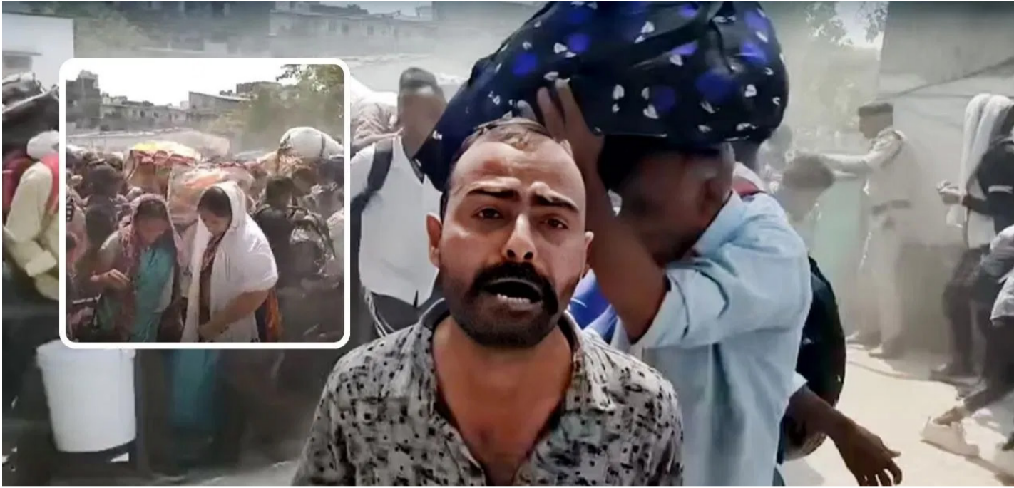
उधना रेलवे स्टेशन पर उमड़ती भीड़ इस संकट की सबसे सजीव तस्वीर बनकर

की आर्थिक धड़कन मानी जाती है, इस संकट से बुरी तरह प्रभावित हुई है। गैस की कमी ने उत्पादन को धीमा कर दिया है, जिससे फैक्ट्रियों में काम ठप पड़ने लगा है। आंकड़ों के अनुसार, जहां पहले रोजाना करीब 6.5 करोड़ मीटर कपड़े का उत्पादन होता था, वह अब घटकर लगभग 4.5 करोड़ मीटर रह गया है। यह गिरावट सिर्फ आंकड़ों में नहीं, बल्कि लाखों मजदूरों की रोजी-रोटी पर सीधा असर डाल रही है। उद्योगों को रोजाना लगभग 15 हजार गैस सिलेंडर की जरूरत होती है, लेकिन सप्लाई में आई कमी ने उत्पादन की रफ्तार तोड़ दी है। इसका सबसे बड़ा असर उन मजदूरों पर पड़ा है, जो दूसरे राज्यों—खासकर उत्तर प्रदेश और बिहार—से सूरत में काम करने आते हैं। अनुमान है कि अब तक करीब 30 प्रतिशत मजदूर, यानी लगभग 3 लाख लोग, शहर छोड़ चुके हैं। यह पलायन अचानक नहीं, बल्कि पिछले एक-दो महीनों से लगातार जारी है।