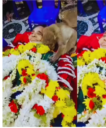
हो गई और बंदर के विलाप ने भालाभला को आंखों में आंसू ला दिए। कर्नाटक के

(छगनलाल मेवाड़ा द्वारा) सूरत। हमारे यहाँ एक कहावत है, “अच्छे कर्म करो और उन्हें समुद्र में बहा दो।” इसका अर्थ यह है कि यदि आप किसी जानवर, पक्षी या गरीब इंसान की मदद बिना किसी अहंकार या प्रतिफल की अपेक्षा के करते हैं, तो वही सच्ची परोपकारिता है। इसे निस्वार्थ सेवा कहते हैं, और उस निस्वार्थ सेवा के फल स्वरूप, पथर दिल इंसान भी विघ्नभ्र हो जाता है और आपसे घनिष्ठ संबंध बनाने के लिए विवश हो जाता है। चाहे वह व्यक्ति कितना भी खूंखार जंगली जानवर क्यों न हो, क्यों नहीं? यहाँ एक ऐसी ही कहानी है, जिसमें एक महिला, जो हर दिन एक बंदर को खाना खिलाती थी, की मृत्यु