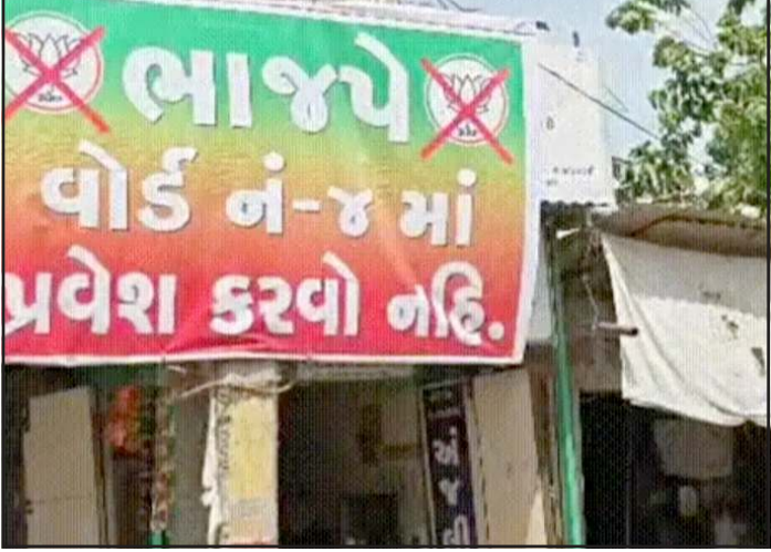
સુવિધાઓનો અભાવ છે. રોડ રસ્તા અને ગટર તેમજ પાણી જેવી પાયાની જરૂરીયાતો માટે વારંવાર રજૂઆતો કરવા છતાં તંત્ર કે રાજકીય નેતાઓ દ્વારા કોઈ નકકર કામગીરી કરવામાં આવી નથી, જનતામાં એવો રોષ જોવા મળી રહ્યો છે કે જ્યારે મત ની જરૂર

પ્રતિનિધિ, ગાંધીનગર સાબરકાંઠા જિલ્લાના હિંમતનગર નજીક આજે શુક્રવારે મુખ્યમંત્રી સભા ગજવવાના હતા તે અગાઉ જ જિલ્લાના વડાલી શહેરમાં સ્થાનિક સ્વરાજ્યની ચૂંટણીના માહોલ વચ્ચે ભાજપને વધુ એક મુશ્કેલીનો સામનો કરવો પડે તેવો ઘાટ સર્જાયો છે.