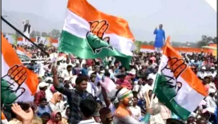
પ્રદેશ કોંગ્રેસ પ્રમુખ અમિત યાવડા અને પૂર્વ પ્રદેશ પ્રમુખ ભરતસિંહ સોલંકીને ભાજપે તેમના ગઢ માં જ ઘુણ ચટાવી હોય તેવો ઘાટ સર્જાયો છે. એક રીતે કોંગ્રેસના ઉમેદવારોની

પ્રતિનિધિ, ગાંધીનગર સ્થાનિક સ્વરાજ્યની ચૂંટણીમાં પ્રદેશ કોંગ્રેસ પ્રમુખ અમિત યાવડાના ગઢ આણંદ માં જ કોંગ્રેસનો રકાસ થયો છે. કોંગ્રેસ પ્રમુખના ક્ષેત્રમાં જ કોંગ્રેસના ૩૯ ઉમેદવારો પાણીમાં બેસી ગયા છે. પ્રમુખ પોતે પણ તેમના ઉમેદવારોને સાચવી શક્યા ન હોવાનું બહાર આવ્યું છે. આમ પ્રદેશ કોંગ્રેસના પ્રમુખની રણનીતીનો તેમના ગઢ માં જ ફિયાસ્કો થયો છે. આણંદમાં ભાજપે ચૂંટણી પહેલા જ જીતી પાતું પોલાવ્યું છે. કારણ કે કોંગ્રેસના ઉમેદવારો પાણીમાં બેસી જતા ભાજપના ઉમેદવારો બિનહરીફ જાહેર થયા છે. પ્રદેશ કોંગ્રેસ પ્રમુખ અમિત યાવડા અને પૂર્વ પ્રદેશ પ્રમુખ ભરતસિંહ સોલંકીને ભાજપે તેમના ગઢ માં જ ઘુણ ચટાવી હોય તેવો ઘાટ સર્જાયો છે. એક રીતે કોંગ્રેસના ઉમેદવારોની પસંદગીને લઈને પણ સવાલો ઉઠી રહ્યા છે. જેમાં લંગડા ઘોડા જેવા કે પછી લગના ઘોડા જેવા ઉમેદવારો પસંદ કરાયા હતા. એક તરફ કોંગ્રેસનો આક્ષેપ છે કે અમારા