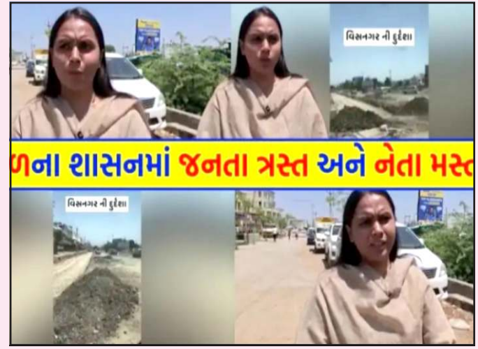
જનતા શાસનમાં જનતા ત્રસ્ત અને નેતા મસ્ત

છે. એવામાં સસરાના શાસનકાળમાં વિકાસ મુદે કેમ કોઈ સવાલ ન ઉઠાવ્યા ? તેને લઈને હવે આશ્ચર્ય ઉઠી રહ્યા છે. ટીકીટ ન મળતા રાજવી એ બળાપો કાઢવાનો સોશીયલ મીડીયા પર ઘાવો થઈ રહ્યો છે. તો બીજી તરફ રાજવી પટેલનો ઘાવો છે કે ભિમાર દાદીને એમ્બ્યુલન્સમાં લઈ જતા ખરાબ રોડ રસ્તાને લીધે ભારે હાલાકી પડી અને ત્યારબાદ તેણે આ વિડીયો બનાવવાનું નકકી કર્યું, વિસનગરના વિકાસ પર ધ્યાન દેવા તેણે વડાપ્રધાન મોદી અને મુખ્યમંત્રીને અપીલ કરી છે.