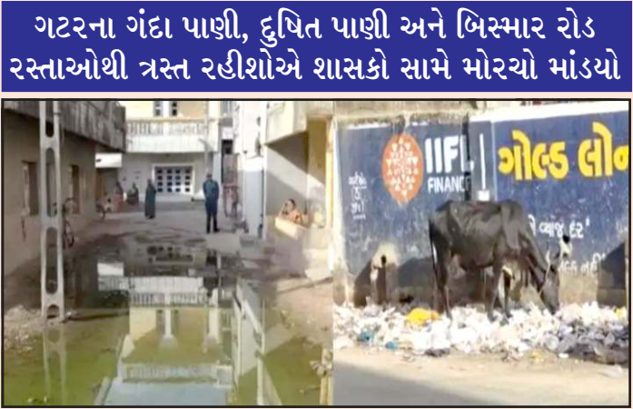
ગટરના ગંદા પાણી, દુષિત પાણી અને બિસ્માર રોડ રસ્તાઓથી ત્રસ્ત રહીશોએ શાસકો સામે મોરચો માંડયો

પ્રતિનિધિ, ગાંધીનગર તસવીર યુનુસ મેમણ ૨૬ એપ્રિલે વોજાનરી પાટણ નગરપાલિકાની ચૂંટણી અગાઉ વોર્ડ નં. ૪ માં રાજકીય ગરમાવો તેજ બન્યો છે. જોકે આ ગરમાવો વિકાસના કામોને લઈને નહી પરંતુ વરસોથી વણઉકેલાયેલી સમસ્યાઓને લઈને છે. સિધ્ધેશ્વરી પાર્ક થી લઈને ઓવરબ્રિજ નીચેની સોસાયટીઓ સુધી જનતામાં સત્તાધારી ભાજપ પક્ષ પ્રત્યે ભારે નારાજગી જોવા મળી રહી છે. વોર્ડ નં. ૪ માં પાયાની સુવિધાઓના નામે શુન્યતા જોવા મળી રહી છે. સિધ્ધેશ્વરી પાર્ક અને આકાશગંગા ફ્લેટમાં ગટરના પાણી લોકોના ઘરો અને યોગાનમાં ફરી વળ્યા છે. પાલિકાનું રીપેરીંગ કામ માત્ર કામચલાઉ સાબિત થયું છે.