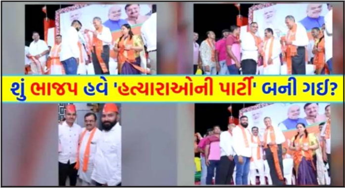
શું ભાજપ હવે 'હત્યારાઓની પાર્ટી' બની ગઈ?