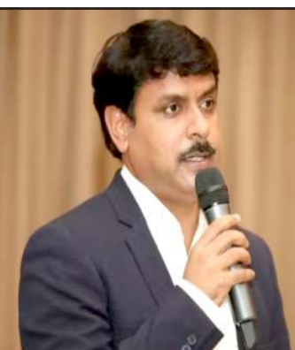
પારદર્શિતા ચકાસવી પડશે તેમજ આ તમામનો ચુંટણી આયોગને દરેક