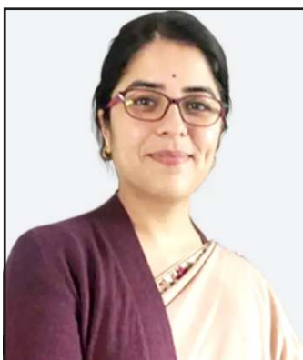
તબક્કાની પ્રગતિ અને મુદ્દાઓ વિશે વિગતવાર અહેવાલ મોકલવો પડશે.