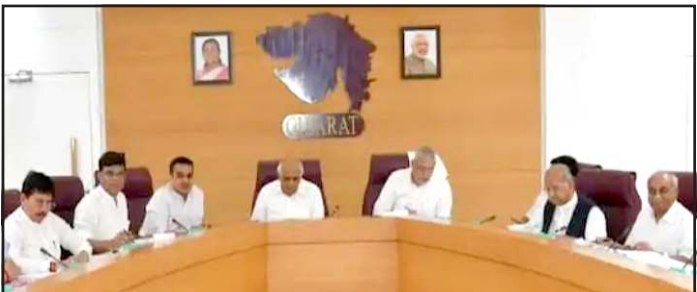
પાર્લામેન્ટ્રી બોર્ડ બેઠક લાંબી ચાલવાનું મુખ્ય કારણ ઉમેદવાર પસંદગીમાં જોવા મળતી આંતરીક ખેંચતાણ છે.