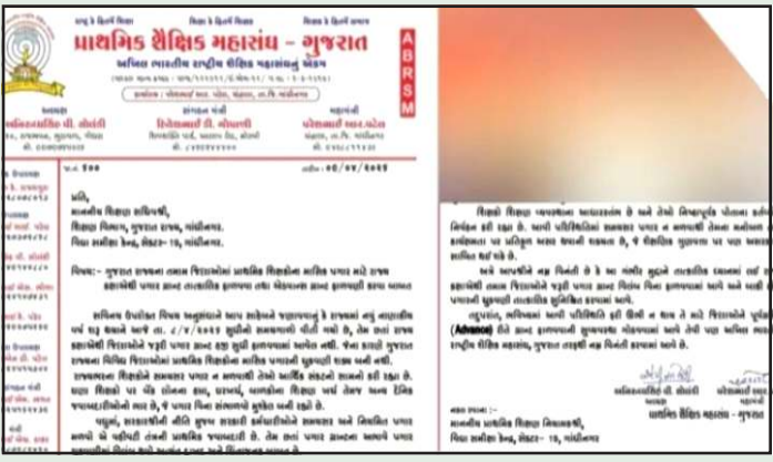
જણાવવામાં આવ્યું છે કે ભવિષ્યમાં આવી સ્થિતિ ફરીથી પેદા ન થાય તે માટે સરકારે દર મહિને એડવાન્સમાં ગ્રાન્ટ ફાળવવી જોઈએ.

પ્રતિનિધિ, ગાંધીનગર રાજ્યના પ્રાથમિક શિક્ષણ વિભાગમાં ફરજ બજાવતા હજારો શિક્ષકો માટે ચાલુ માસ આર્થિક સંકટ લઈને આવ્યો છે. રાજ્યના તમામ જિલ્લાઓમાં શિક્ષકોનો ચાલુ મહિનાનો પગાર હજુ સુધી થયો નથી. જેને પગલે શિક્ષકોમાં ભારે રોષ અને ચિંતા જોવા મળી રહી છે. ગ્રાન્ટના અભાવે પગાર અટકી પડતા હવે આ મામલો રાજ્ય સરકારના દરવાજે પહોંચ્યો છે. પગાર ન થવાને કારણે શિક્ષકોના ઘરના બજેટ ખોરવાયા છે અને લોનાના હપ્તા તેમજ અન્ય ખર્ચાઓ ચુકવવામાં મુશ્કેલી પડી રહી છે. આ ગંભીર સ્થિતિને ધ્યાને લઈ પ્રાથમિક શૈક્ષણિક સંઘ દ્વારા રાજ્ય સરકારને લેખિતમાં રજુઆત કરવામાં આવી છે. સંઘે માંગ કરી છે કે તાત્કાલીક ધોરણે પગાર માટેની ગ્રાન્ટ મંજૂર કરવામાં આવે જેથી શિક્ષકોના પગારમાં જમા થઈ શકે, રાજ્ય સરકારને ઉભા થતા આ પ્રશ્નના કાયમી ઉકેલ માટે પણ સંઘે સરકાર સામે પ્રસ્તાવ મુક્યો છે. રજુઆતમાં જણાવવામાં આવ્યું છે કે ભવિષ્યમાં આવી સ્થિતિ ફરીથી પેદા ન થાય તે માટે સરકારે દર મહિને એડવાન્સમાં ગ્રાન્ટ ફાળવવી જોઈએ. જો સમયસર ગ્રાન્ટ મળે તો વહિવટી પ્રક્રિયાને કારણે થતો વિલંબ ટાળી શકાય છે. અત્યારે તો હજારો શિક્ષકો આશા ભરી નજરે સરકાર તરફ જોઈ રહ્યા છે કે ક્યારે તેમના મહેનતાણાની રકમ તેમના ખાતામાં જમા થાય છે. આગામી દિવસોમાં ગ્રાન્ટ રીલીઝ નહી થાય તો શૈક્ષણિક સંઘ દ્વારા આંદોલનાત્મક પગલા લેવાની પણ ચર્ચાઓ ચાલી રહી છે.