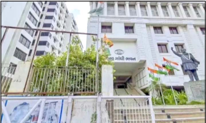
સુનિયોજિત કાવતરૂ હોવાનું જણાય છે. ૩મી ઉમેદવારો જાહેર ન કરવા અને ફોર્મ માટે લીગલ ટીમ સહિતની વ્યવસ્થાનો અભાવ હોવાના આક્ષેપો ઉમેદવારો જ કરી રહ્યા છે.