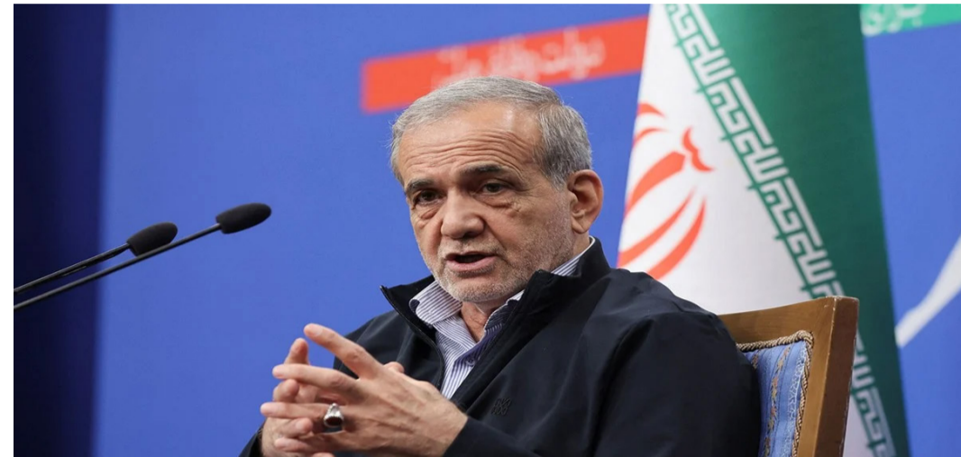
प्लेटफॉर्म X के जरिए सामने आया, जिसने देखते ही देखते अंतरराष्ट्रीय स्तर पर सुर्खियां बटोरें। इस बयान का असर यह हुआ कि ईरान के भीतर एकजुटता और प्रतिरोध की

पुलों और अहम बुनियादी ढांचे को व्यापक हवाई हमलों के जरिए निशाना बनाया जाएगा। उन्होंने यहां तक कहा कि यह कार्रवाई इतनी तेज और व्यापक होगी कि कुछ ही घंटों में ईरान की प्रमुख संरचनाएं पूरी तरह निष्क्रिय हो जाएंगी। इस कड़े रुख के जवाब में ईरान की तरफ से जो प्रतिक्रिया आई है, उसने हालात को और अधिक गंभीर बना दिया है। राष्ट्रपति मसूद पेजेशकियन ने सार्वजनिक रूप से यह दावा किया कि 1.4 करोड़ से अधिक ईरानी अपने देश की रक्षा के लिए जान देने को तैयार हैं। उन्होंने यह भी कहा कि वे स्वयं भी देश के लिए हर तरह का बलिदान देने को तत्पर हैं। यह बयान केवल एक राजनीतिक प्रतिक्रिया नहीं, बल्कि एक ऐसे राष्ट्रवादी भावनात्मक आह्वान के रूप में देखा जा रहा है, जो आम जनता को सीधे इस टकराव के केंद्र में ला देता है। पेजेशकियन का यह संदेश सोशल मीडिया