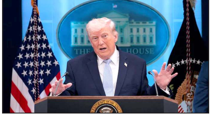
મોડલ આંતરરાષ્ટ્રીય સ્તરે કેટલી આર્થિક હુમલાનો સામનો કેવી રીતે સ્વીકૃતિ મેળવે છે અને ઈરાન આ કરે છે.

માત્ર ૩૮ દિવસમાં ઈરાનને હરાવ્યાનો ટ્રમ્પનો દાવો. અગાઉ વેનેઝુએલામાં કરેલી કાર્યવાહીને સફળ ગણાવી હતી. હવે જોવાનું એ રહેશે કે ટ્રમ્પનું આ ઓઈલ ફોર વોર