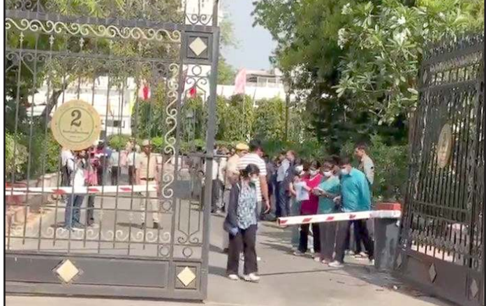
જણાવ્યા અનુસાર, અચાનક એક અજ્ઞાત કાર પૂબ જ તેજ ગતિએ આવી અને મુખ્ય ગેટને જોરદાર ટક્કર મારી હતી. ટક્કર એટલી જબરદસ્ત

હતી. દિલ્હી પોલીસના ઉચ્ચ અધિકારીઓ હાલ વિધાનસભા પરિસરમાં તપાસ કરી રહ્યા છે. ડીસીપીના જણાવ્યા અનુસાર, કારની ટક્કરથી લોખંડનો ગેટ પણ ક્ષતિગ્રસ્ત થયો છે. હાલ પોલીસ સીસીટીવી ફૂટેજ ખંગાળી રહી છે અને યુપી નંબરની તે કારના આધારે આરોપીઓની ઓળખ કરવા અને તેમને પકડવા માટે ચક્રો ગતિમાન કર્યા છે. દિલ્હી વિધાનસભામાં બનેલી આ ઘટનાએ સંવેદનશીલ વિસ્તારોની સુરક્ષાના દાવાઓ અંગે અનેક પ્રશ્નો ઉભા કર્યા છે. પ્રત્યક્ષદર્શીઓના