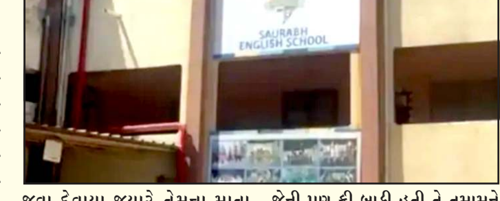
જવા દેવાયા જયારે તેમના માતા પિતાએ શાળાએ રૂબરૂ આવીને લેખિતમાં કે મોબિકમાં બાંહેધરી (ખાત્રી) આપી કે તેઓ બાકીની ફી ક્યારે ભરશે, એક વાલીએ પોતાની વચ્ચે ઠાલવતા જણાવ્યું હતું કે સવારે ૭:૩૦ કલાકે મારી ટિકિટનો ફોન આવ્યો અને તેણે રડતા રડતા કહ્યું કે મને પરીક્ષા આપવાની ના પાડવામાં આવી છે, સ્કુલવાળા કહે છે કે અત્યારે ફી ભરશો તો જ પરીક્ષા આપવા મળશે, અમારી માત્ર છેલ્લા સેમેસ્ટર ની ૬ ફાઈન રૂપિયા ફી બાકી છે. બાકી આખા વરસની ફી અમે ભરી દીધી છે, માત્ર મારી ટિકિટ જ નહી,

પ્રતિનિધિ, ગાંધીનગર રાજ્યમાં આજે સોમવાર થી પ્રાથમિક શાળાઓમાં ધોરણ ૩ થી ૫ ની વાર્ષિક પરીક્ષાઓનો પ્રારંભ થઈ ચુક્યો છે. પરંતુ પરીક્ષાના પહેલા દિવસે જ અમદાવાદના નવા વાડજ વિસ્તારમાં આવેલી સૌરભ સ્કુલમાં મોટો વિવાદ સર્જાયો હતો. વાલીઓએ ગંભીર આક્ષેપ લગાવ્યો હતો કે છેલ્લા સેમેસ્ટર ની ફી બાકી હોવાના બહાને ૨૦ કરતા વધુ નાના વિદ્યાર્થીઓને પરીક્ષામાંડની બહાર ઉભા રાખી દેવામાં આવ્યા હતા અને પરીક્ષામાં બેસવા દેવામાં આવ્યા ન હતા. પરીક્ષા આપવા આવેલા નાના ભુલકાઓને અટકાવવા મુદ્દે વાલીઓએ સ્કુલ મેનેજમેન્ટ સામે ભારે આકોશ ઠાલવ્યો હતો. વાલીઓએ એવો પણ દાવો કર્યો હતો કે જે વિદ્યાર્થીઓની ફી બાકી હતી તેમને ત્યારે જ કલાસમાં