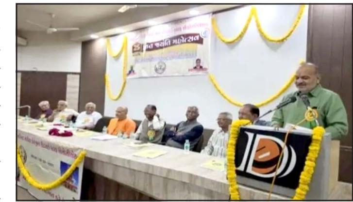
બનાવ્યા છે, આવા નેતા નડીયાદ કે ખેડા જિલ્લામાં નહીં મળે, કારણ કે જે મળે તે ઘર ભરે બહાર આપે નહી, આ નિવેદન બાદ ભારે ચર્ચાઓ જાગી છે. એકબાજુ સ્થાનિક સ્વરાજ્યની ચુંટણીનો ગરમાવો તો બીજી તરફ કમચારીઓના સન્માન સમારોહમાં વક્તવ્ય આપતી વખતે તેમણે આ વાત અત્યંત અપેક્ષા સાથે કરી હતી. આ નિવેદનનો વિડીયો સોશીયલ મીડીયા પર વાયરલ થતા જ રાજકીય