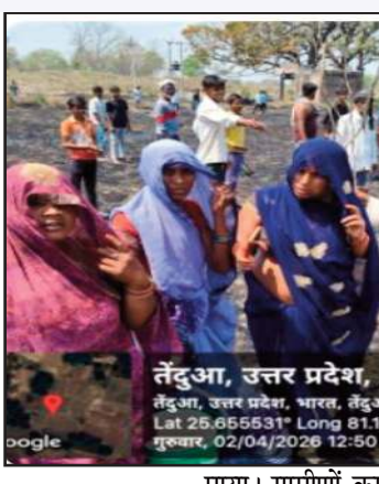
तेंदुआ, उत्तर प्रदेश, भारत

खड़ी गेहू की फसल तक पहुंच गई और देखते ही देखते आग ने विकराल रूप ले लिया। घटना की सूचना मिलते ही सैकड़ों ग्रामीण मौके पर पहुंच गए और काफी मशक्कत के बाद आग पर काबू