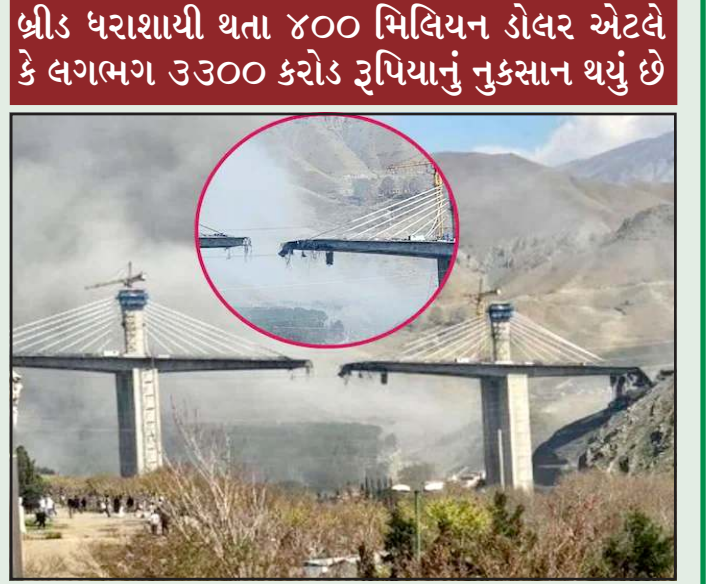
બ્રીડ ધરાશાયી થતા ૪૦૦ મિલિયન ડોલર એટલે કે લગભગ ૩૩૦ કરોડ રૂપિયાનું નુકસાન થયું છે

બની જાય. આ હુમલો રાજધાની તેહરાનથી એટલો નજીક થયો છે કે ઈરાનની સુરક્ષા વ્યવસ્થાની પોલ ખુલી ગઈ છે. હવે દુશ્મન સીધા ઈરાનના ઘરમાં ઘૂસીને હુમલા કરી રહ્યા છે. માહિતી મળી રહી છે કે આ હુમલો એટલો જોરદાર હતો કે પુલ ઉડી જતા જ ઈરાનના અનેક મહત્વપૂર્ણ વિસ્તારોમાં વીજળી બંધ થઈ ગઈ અને પાવર ગ્રિડ ઠપ થઈ ગયો. આ કાર્યવાહી ઈરાન માટે મોટું આર્થિક ઝટકો સાબિત થઈ છે, જેના કારણે આખા વિસ્તારમાં મોટા યુદ્ધનો ખતરો વધુ વધી ગયો છે.