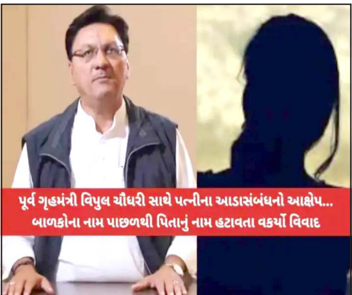
પૂર્વ ગૃહમંત્રી વિપુલ ચૌધરી સાથે પત્નીના આડસંબંધનો આક્ષેપ... બાળકોના નામ પાછળથી પિતાનું નામ દર્શાવતા વકર્યો વિવાદ

પ્રતિનિધિ, ગાંધીનગર ગુજરાતના રાજકારણ અને સહકારી ક્ષેત્રમાં ગરમાવો લાવી દે તેવી એક ઘટના બહાર આવતા બળભળાટ મચી જવા પામ્યો છે. વડોદરા ના ગોત્રી વિસ્તારમાં રહેતા એક વ્યક્તિએ પોતાની પત્ની અને રાજ્યના પૂર્વ ગૃહમંત્રી વિપુલ ચૌધરી વચ્ચે અનૈતિક સંબંધો હોવાના ગંભીર આક્ષેપો કરતા હડકંપ મચી જવા પામ્યો છે. એટલુ જ નહીં, આ વ્યક્તિએ પોતાની પત્ની અને રાજ્યના પૂર્વ ગૃહમંત્રી વિપુલ ચૌધરીના સંબંધોના આક્ષેપ સાથે કોર્ટના દ્વાર ખખડાવ્યા છે. આ મામલે કોર્ટના આદેશ બાદ અટલાદરા પોલીસે શહેરની પ્રતિષ્ઠિત ગણાતી વિશ્વેશ્વર (વિશ્વેર) સ્કુલના સંચાલક અને બાળકોની માતા વિરુદ્ધ ગુન્હો નોંધી તપાસ હાથ ધરી છે. આ ઘટનામાં મળતી માહિતી અનુસાર ગોત્રી વિસ્તારમાં રહેતા ૪૪ વર્ષીય વ્યક્તિના વર્ષ ૨૦૧૧ માં જન્મ થયા હતા. અને ૧૫ વર્ષના હવે જીવન દરમિયાન તેમને બે પુત્રીઓ જન્મી છે. છેલ્લા કેટલાક સમયથી