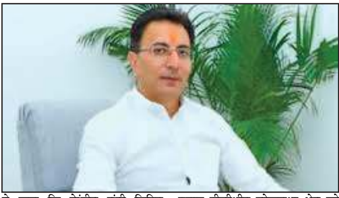
ने कहा कि केंद्रीय मंत्री जितिन प्रसाद पीलीभीत लोकसभा क्षेत्र को

मॉडल लोकसभा क्षेत्र बनाने का प्रयास लगातार कर रहे हैं जनपद में कई महत्वपूर्ण मार्गों और पुलों की मरम्मत तथा सुरक्षा संबंधी कार्य लंबे समय से प्रस्तावित थे। अब शासन स्तर से स्वीकृति मिलने के बाद इन कार्यों में तेजी आयेगी। योजना के तहत विभिन्न स्थानों पर बाँक्स कल्वर्ट, आरसीसी पुलिया निर्माण, पहुंच मार्ग और सुरक्षा कार्यों को दुस्तत किया जाएगा। विशेष रूप से कटैया नवादा, पनधेली नदी क्षेत्र, बनकटी मार्ग, माधोटांडा-कलीनगर मार्ग सहित अन्य स्थानों पर जर्जर पुलों और मार्गों की मरम्मत की जाएगी। इससे बरसात के समय आने वाली दिक्कतों से भी लोगों को राहत मिलेगी।