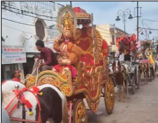
भगवान राम की पताका लेकर जयकारे लगाते हुए चल रहे थे। होली की चौपाई की टोली गीत गाती हुई आगे बढ़ रही थी, जबकि बँड बाजे मधुर ध्वनि बजा रहे थे। भगवान राम, सीता शिव-पार्वती सहित कई देवी-देवताओं की झांकियां विशेष आकर्षण

यह शोभायात्रा नगर के बड़ा स्थल मंदिर से परंपरागत तरीके से शुरू हुई। यात्रा बड़ा स्थल चौराहे से होते हुए होली चौराहा, गोपी टॉकीज मार्ग और मध्य बाजार सहित विभिन्न मार्गों से गजरी। अंत में यह श्यामल दास की माण पर जाकर संपन्न हुई। शोभायात्रा में सबसे आगे श्रद्धालु