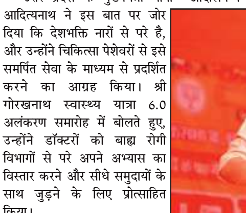
में पहल की सफलता को नोट किया। थारू समुदाय पर ध्यान केंद्रित करते हुए, आदित्यनाथ ने उनकी जीवन स्थितियों में सुधार के लिए सरकारी प्रयासों को लक्षित किया। प्रत्येक परिवार को एक घर, बिजली कनेक्शन, सौर पैनल, स्वास्थ्य कार्ड

(जीएनएस)। उत्तर प्रदेश के मुख्यमंत्री योगी आदित्यनाथ ने इस बात पर जोर दिया कि देशभक्ति नारों से परे है, और उन्होंने चिकित्सा पेशेवरों से इसे समर्पित सेवा के माध्यम से प्रदर्शित करने का आग्रह किया। श्री गोरखनाथ स्वास्थ्य यात्रा 6.0 अलंकरण समारोह में बोलते हुए, उन्होंने डॉक्टरों को बाह्य रोगी विभागों से परे अपने अभ्यास का विस्तार करने और सीधे समुदायों के साथ जुड़ने के लिए प्रोत्साहित किया। आदित्यनाथ समावेशी विकास के पैरोकार हैं। आदित्यनाथ ने समावेशी विकास के महत्व पर प्रकाश डाला, यह कहते हुए कि यदि कोई भी सामाजिक समूह वंचित रहता है तो राष्ट्रीय प्रगति बाधित होती है। उन्होंने चिकित्सा और सुझाव दिया कि डॉक्टर हर महीने इस उद्देश्य के लिए एक रविवार समर्पित करें। यह पहल सात सीमावर्ती जिलों के आदिवासी समुदायों को लक्षित करती है, जो अक्सर उपेक्षित आबादी को आवश्यक चिकित्सा देखभाल प्रदान