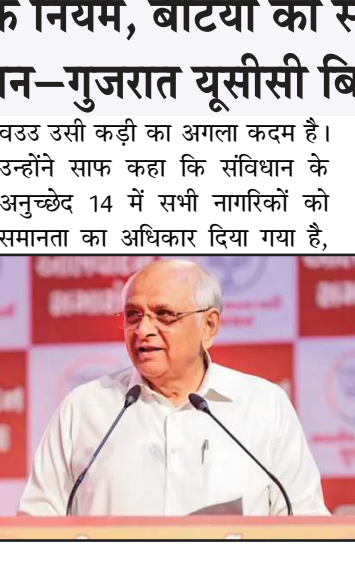
लिव-इन का रजिस्ट्रेशन-गुजरात यूसीसी बिल के 5 बड़े फैसले

(जीएनएस)। गुजरात के मुख्यमंत्री भूपेंद्र पटेल ने विधानसभा में यूनियनमंत्रि सचिव कोड यानी UCC बिल 24 मार्च को पेश किया। इसे सिर्फ एक कानून नहीं, बल्कि "समानता और एकरूपता" की दिशा में बड़ा कदम बताया जा रहा है। सरकार का दावा है कि यह बिल समाज में लंबे समय से चले आ रहे अलग-अलग निजी कानूनों की जगह एक समान व्यवस्था लाएगा, जिससे फायदा होगा। मुख्यमंत्री भूपेंद्र पटेल ने अपने भाषण में नरेन्द्र मोदी के नेतृत्व में लिए गए बड़े फैसलों-अनुच्छेद 370 हटाने, तीन तलाक कानून और राम मंदिर निर्माण-का जिक्र करते हुए कहा कि