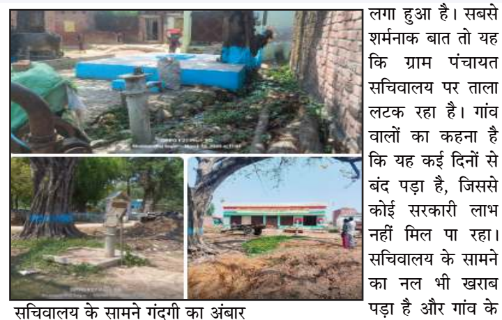
सचिवालय के सामने गंदगी का अंबार मंदिर पर सरकारी नल भी ठप पड़ा

(जीएनएस)। पीलीभीत/विकासखंड बीसलपुर की ग्राम पंचायत दुकसी में सरकारी सुविधाओं की दुर्दशा ने ग्रामीणों को परेशान कर दिया है। प्राइमरी स्कूल में पानी की व्यवस्था चरमरा गई है, विकलांगों के लिए शौचालय की रेलिंग टूटी पड़ी है। गांव में जगह-जगह इंडियन मार्काई डंपिंग खाबाब हो चुके हैं—एक नहीं, दर्जनों से अधिक। ग्राम प्रधान और सचिव की नजरअंदाजी या घोटालेबाजी की यह स्थिति उजागर हो रही है। इसकी हालत खस्ता है,