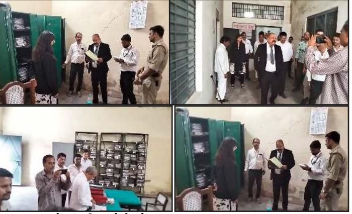
सुचारु रूप से संचालित होती रहें।

जिला जज ने अधिकारियों को निर्देशित किया कि न्यायालय आने वाले लोगों को किसी प्रकार की असुविधा न हो और सभी व्यवस्थाएं