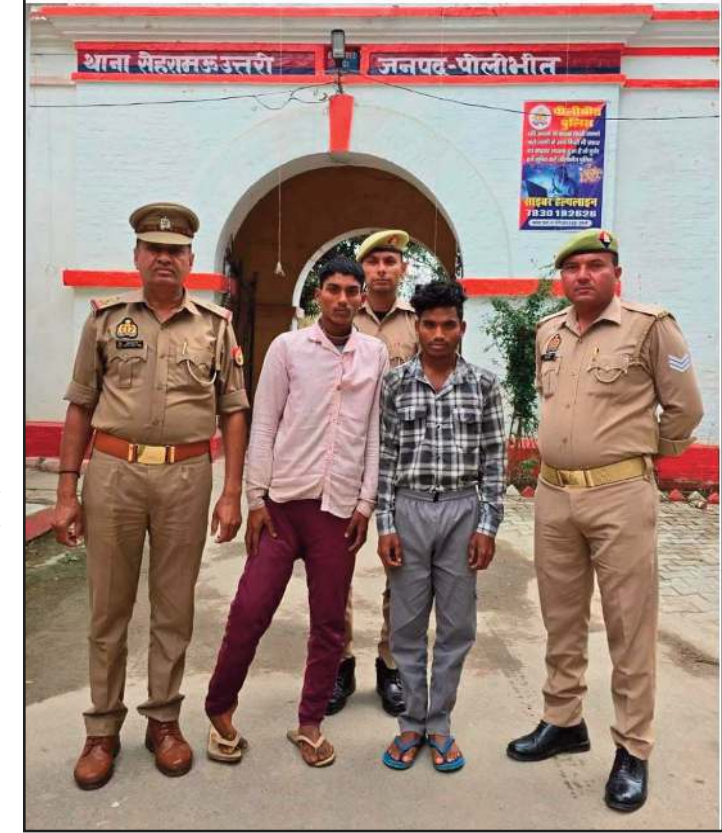
रुपये का लालच देकर बगला लिया। चंगुल से छूटकर घर पहुंचा। किशोर वह उसे गन्ने के खेत में ले गए। जहां सहमा हुआ था। जिसके बाद मां के कुकर्म किया। बाल अपचारियों के पृष्ठे पर किशोर ने घटना की जानकारी

रुपये का लालच देकर किशोर को गन्ने के खेत में ले जाकर दो बाल अपचारियों ने उसके साथ कुकर्म की घटना को अंजाम दिया। बारदात से सहमे किशोर ने घर पहुंचकर घटना की जानकारी अपनी मां को दी। जिसके बाद किशोर की मां ने थाने पहुंचकर मामले की शिकायत पुलिस की तहरीर देकर की। पुलिस ने किशोर की मां की तहरीर पर दोनों के खिलाफ मुकदमा दर्ज किया। किशोर का मेडिकल परीक्षण भी कराया गया। जिसके बाद पुलिस ने मामले में त्वरित कार्रवाई करते हुए कुकर्म की घटना को अंजाम देने वाले दो आरोपियों को गिरफ्तार कर जेल भेज दिया। थाना सहरामऊ उत्तरी क्षेत्र के एक गांव निवासी महिला ने पुलिस को बताया कि शुक्रवार की शाम उसका नाबालिग पुत्र घर के बाहर खेल रहा था। आरोप है कि पड़ोस के ही दो किशोरों ने उसे