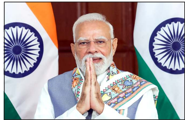
અમે દરેક પક્ષ સાથે સંવાદ કરી રહ્યા છીએ. આવા પ્રયાસોને કારણે હોર્મુઝ સ્ટ્રેટમાં ફસાયેલા અમારા અનેક જહાજ ભારત આવી પણ ગયા છે.

વિદ્યાર્થીઓ અભ્યાસ કરે છે.' કૂડ ઓઈલને લઈને વડાપ્રધાન મોદીએ કહ્યું કે, છેલ્લા ૧૧ વર્ષમાં ભારતે પોતાના કૂડ ઓઈલ ઈમ્પોર્ટનું વિવિધીકરણ (ડાઈવર્સિફિકેશન) કર્યું છે. અગાઉ ૨૭ દેશોમાંથી ઈમ્પોર્ટ થતું હતું, આજે ૪૧ દેશોમાંથી ઈમ્પોર્ટ થતું રહી છે. અમારી રિક્ષાઈનિંગ ક્ષમતામાં પણ વધારો થયો છે. અમારી પાસે ૫૩ લાખ મેટ્રિક ટન કૂડ ઓઈલ રિઝર્વ છે. અમારું લક્ષ્ય ૬૫ લાખ મેટ્રિક ટનનું છે. અમારો પ્રયાસ છે કે દરેક જરૂરી સામગ્રી સાથે જોડાયેલા જહાજ સુરક્ષિત રીતે ભારત પહોંચે.