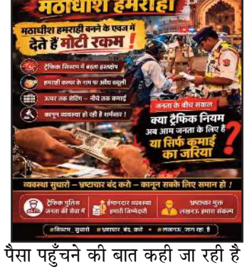
पैसा पहुँचने की बात कही जा रही है

(जीएनएस)। लखनऊ। उत्तर प्रदेश की राजधानी लखनऊ क्षेत्र में ट्रैफिक पुलिस विभाग को लेकर एक बार फिर गंभीर आरोप सामने आ रहे हैं। सूत्रों के मुताबिक 'हमराही' बनने के नाम पर कथित तौर पर मोटी रकम का लेन-देन किया जा रहा है। आरोप है कि इस पूरे खेल में अवैध वसूली का एक संगठित तंत्र काम कर रहा है, जिसमें नीचे से लेकर ऊपर तक