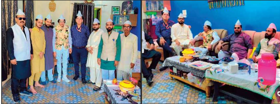
और खास बना दिया, ये टोपी सिर्फ एक पहनावा नहीं बल्कि अदब, इज्जत और अपनत्व की निशानी बन गई। माहौल में उस वक्त हल्की मुस्कान और ठहाके भी गुंज उठे जब मजाकिया अंदाज में कहा गया— 'ये