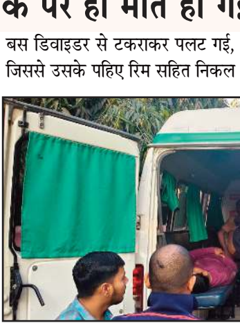
गए हादसे के बाद यात्रियों में चीख-पुकार मच गई। आसपास से गुजर रहे वाहन चालकों ने तुरंत पुलिस को सूचना दी। बांगरमऊ थाना प्रभारी और यूपीडा टीम ने भारी पुलिस बल के साथ

(जीएनएस)। उन्नाव के बांगरमऊ थाना क्षेत्र में आगरा-लखनऊ एक्सप्रेसवे पर सोमवार सुबह एक स्लीपर बस पलट गई। इस हादसे में एक महिला यात्री की मौके पर ही मौत हो गई, जबकि लगभग 20 अन्य यात्री घायल हो गए। सूचना मिलते ही पुलिस और यूपीडा की टीम ने मौके पर पहुंचकर बचाव कार्य शुरू किया। यह दुर्घटना आगरा-लखनऊ एक्सप्रेसवे पर किलोमीटर संख्या 239 पर नसीपुर गांव के पास हुई। बस दिल्ली के जवाहर लाल नेहरू स्टेडियम में एक कार्यक्रम से लौटकर लखनऊ की ओर जा रही थी। प्राथमिक जानकारी के अनुसार, सोमवार सुबह चालक को झपकी आने के कारण बस अनियंत्रित हो गई।