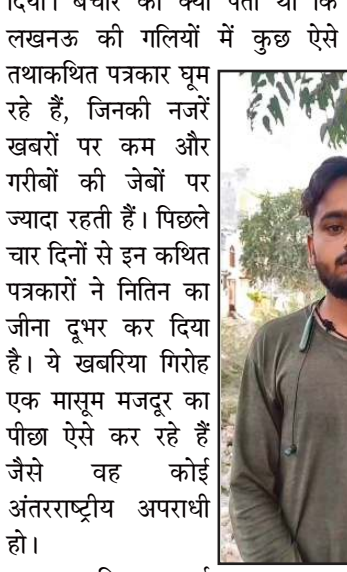
पत्रकारिता का धर्म होता है शोषितों की आवाज बनना, लेकिन इन आईडी धारक लुटेरों ने इसे