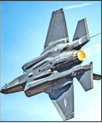
ફૂડ અંગે ગેસ વેપારનો મોટો હિસ્સો આ માર્ગ પરથી પસાર થાય છે. જો આ યુદ્ધ વધુ લાંબું ખેંચાય છે, તો તે વૈશ્વિક અર્થવ્યવસ્થા માટે એક મોટો ફટકો સાબિત થશે. અમેરિકા અને ઈરાન

વચ્ચે ૨૦૨૬માં ચાલી રહેલા તણાવ દરમિયાન અમેરિકાને સેનાને મોટું નુકસાન ઉઠાવવું પડી રહ્યું છે. રિપોર્ટ્સ અનુસાર અત્યાર સુધી અમેરિકા ઓછામાં ઓછા ૧૭ સૈન્ય એરક્રાફ્ટ ગુમાવી ચૂક્યું છે, જેમાં ૧૨ ડ્રોન અને ૪ માનવ સંચાલિત વિમાન સામેલ છે. આ ઉપરાંત એક F-35 ફાઈટર જેટને પણ નુકસાન પહોંચ્યું છે. પહેલા જ્યારે ઓપરેશન સિદ્દર દરમિયાન ભારત દ્વારા F-16ને તોડી પાડવાની વાત સામે આવી હતી, ત્યારે અમેરિકાએ તેનું ખંડન કર્યું હતું, પરંતુ હવે સ્થિતિ અલગ જોવા મળી રહી છે અને ડોનાલ્ડ ટ્રમ્પના નેતૃત્વમાં ટ્રમ્પને મોટું સૈન્ય નુકસાન સામે આવ્યું છે. આ ડ્રોસને ઈરાનના