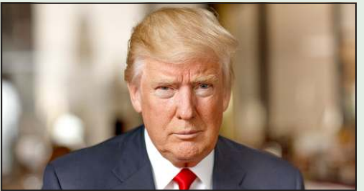
અને તેના જવાબમાં ઈરાનના જવાબી હુમલાની શરૂઆત બાદ ઈરાની સેનાએ સંપૂર્ણ રોકી રાખ્યો છે. ટ્રમ્પે પોસ્ટમાં કહ્યું કે જો ઈરાન ૪૮ કલાકની અંદર જો ઈરાન હોમુઝ સ્ટ્રેટને ખોલશે નહીં તો અમેરિકા તેના અલગ-અલગ પાવર પ્લાન્ટ પર હુમલો કરી તેને તબાહ કરી દેશે. તેની શરૂઆત સૌથી મોટા પ્લાન્ટથી થશે.

ટૂથ સોશિયલ પર એક પોસ્ટમાં ટ્રમ્પે ઈરાનને તે જરૂરી રસ્તો ખોલવાની અપીલ કરી, જેને ઈરાને રોકી રાખ્યો છે (સંપૂર્ણ સમાચાર સેવા)વોશિંગટન અમેરિકા-ઈઝરાયલ અને ઈરાન વચ્ચે ચાલી રહેલા યુદ્ધના ત્રણ સપ્તાહ પૂરા થઈ ગયા છે. તેવામાં અમેરિકાએ ઈરાનને ચેતવણી આપી છે. અમેરિકાના રાષ્ટ્રપતિ ડોનાલ્ડ ટ્રમ્પે રવિવારે ચેતવણી આપતા કહ્યું કે ૪૮ કલાકની અંદર હોમુઝ જલદમરૂઝ થઈ ન ખોલ્યું તો અમેરિકા તેના પાવર પ્લાન્ટ પર હુમલો કરી તબાહ કરી દેશે. અમેરિકાએ સ્પષ્ટ શબ્દોમાં કહ્યું કે તે તેની શરૂઆત સૌથી મોટા પાવર પ્લાન્ટથી કરશે.