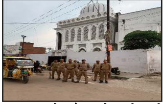
नमाज के दौरान क्षेत्र की सभी