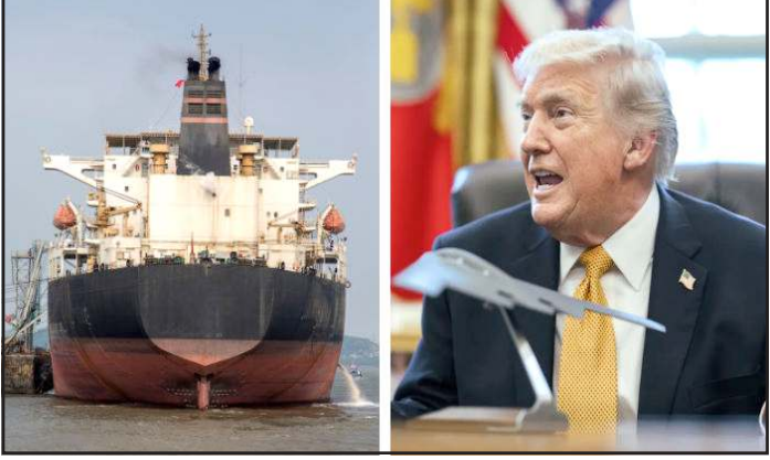
આવી નથી. અમે ઓઈલની કિંમતો ઓછી રાખવા માટે ઈરાનના બેરલનો ઉપયોગ તેની વિરુદ્ધ જ કરીશું. યુદ્ધ શરૂ થયા પછી અને મિડલ ઈસ્ટમાં એનર્જી ઈન્ફ્રાસ્ટ્રક્ચર પર ઈરાની હુમલાઓ બાદ તેલ અને ગેસની

(સંપૂર્ણ સમાચાર સેવા)વોશિંગ્ટન અમેરિકા અને ઈરાન વચ્ચે ઈરાન પર કરેલા હુમલા બાદ મિડલ ઈસ્ટમાં યુદ્ધ ચાલી રહ્યું છે. યુદ્ધના કારણે કુદ ઓઈલના ભાવમાં વધારો થઈ રહ્યો છે. સાથે સાથે ગેસની સપ્લાય પણ ખોરવાઈ છે. જેના કારણે અનેક દેશો મુશ્કેલીમાં મુકાયા છે ત્યારે હવે અમેરિકાએ ઈરાનના ઓઈલ પર લાગેલો પ્રતિબંધ હટાવવાની જાહેરાત કરી છે. જેનો અર્થ છે કે હવે દુનિયાના દેશો ઈરાન પાસેથી ઓઈલ ખરીદી શકશે.