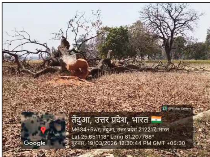
प्रभावी रोक लगाने में नाकाम साबित हो रहा है।

ताजा मामला तेंदुआ गांव का है, जहां वन माफियाओं ने बुधवार देर शाम एक हरे-भरे महुआ के विशाल वृक्ष को काटकर गिरा दिया। ग्रामीणों का कहना है कि क्षेत्र में दिनदहाड़े प्रतिबंधित प्रजाति के पेड़ों की कटाई लगातार बढ़ रही है, लेकिन जिम्मेदार विभाग इस पर